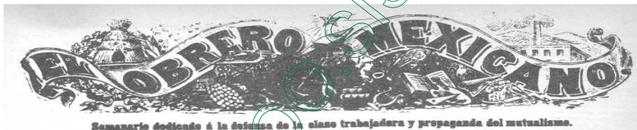
Figura 1: Encabezado del periódico "El obrero Mexicano".

El Obrero Mexicano (1894) 8 , que tenía entre las secciones más destacadas las siguientes, según El Obrero Mexicano del 9 abril de 1894: