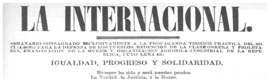
Figura 3: Encabezado del periódico “La Internacional”.

La internacional (1878) 9 es un periódico con tendencia religiosa – socialista, por lo que el panorama es muy amplio, no sólo de las mutualistas, sino del desempleo, la política y del acontecer cotidiano.