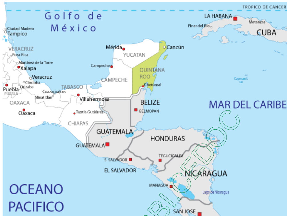
Mapa 1. Situación del Territorio Federal de Quintana Roo