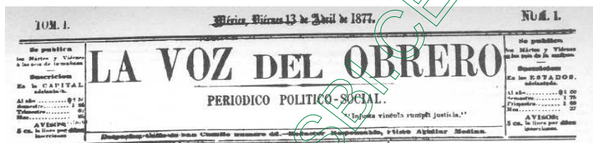
Figura 2: Encabezado del periódico "La Voz del Obrero".

La Voz del Obrero (1877), ésta publicación era un poco más sencilla a diferencia de El Obrero Mexicano . El tema de este periódico decía: la injusticia vincula romper la justicia . El primer ejemplar salió a la luz el 13 de abril de 1877. Se decía ser un periódico político y social en el que se daban a conocer las noticias de las mutualistas y sus principales ideas.