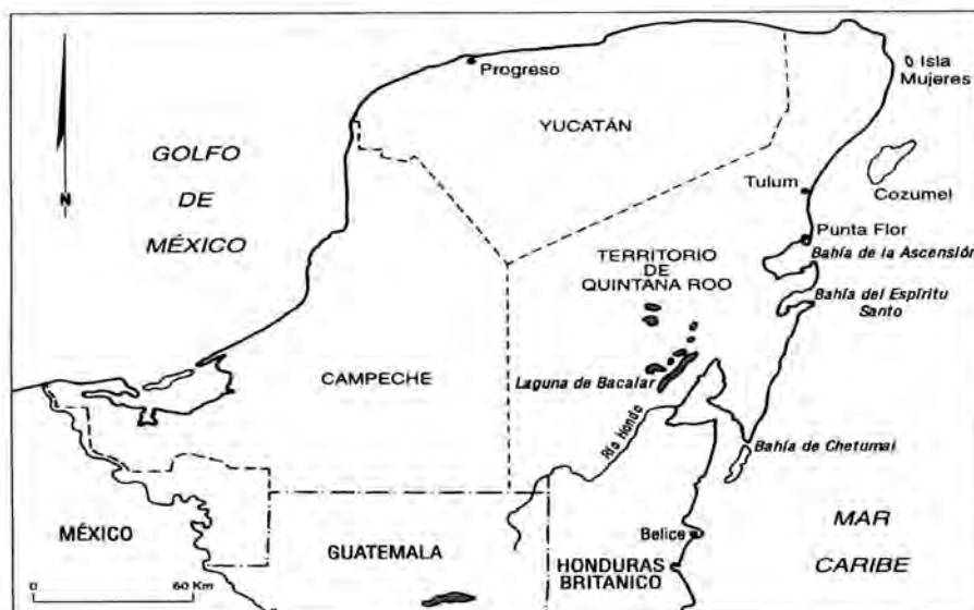
Figura 4: Mapa donde se muestra como quedó dividida la península de Yucatán al crearse el Territorio de Quintana Roo en 1901.

En el año de 1896 se escucharon los primeros rumores de que se crearía un Territorio Federal con una porción territorial perteneciente al Estado de Yucatán; el pretexto que se adujo en aquellos tiempos era que Yucatán no contaba con los suficientes recursos para poder someter a los rebeldes mayas, tanto como para colonizar y explotar los recursos naturales con que contaba la zona oriental de la península. Ya que el principal interés del presidente Porfirio Díaz Mori era el control económico y político de la frontera con Belice y la explotación de los recursos naturales y forestales, se creó años más adelante el territorio que llevaría el apellido del insurgente y yucateco, Don Andrés Quintana Roo.