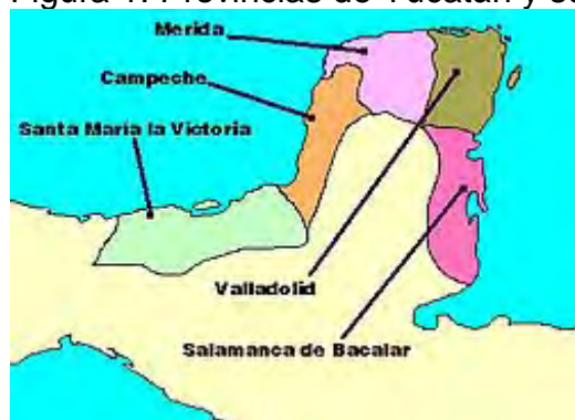
Figura 1: Provincias de Yucatán y sus cabeceras de distrito en 1549.

Yucatán era uno de los Estados con mayor extensión territorial de la naciente República Mexicana, de la que se benefició “tras su independencia” de un territorio que tenía 198,590 km 2 . En esta porción territorial “de acuerdo al censo de 1821” existían dos ciudades, Campeche y Mérida, más dos villas y 222 pueblos. Todos ellos alojaban un total de 538,907 habitantes. Este territorio se encontraba más cerca de Cuba, la última colonia española en América, que del centro del país, ya que tuvo un desarrollo económico y político muy diferente. (Dachary & Arnaiz Burne, 1998, pág. 55)