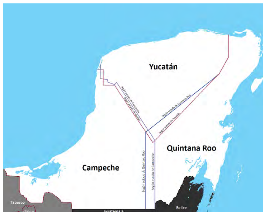
Figura 5: Mapa en el que se representa el conflicto limítrofe entre el Estado de Quintana Roo y sus Estados vecinos.