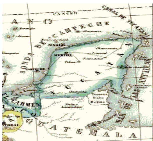
(Mapas antiguos de la península de Yucatán)

Figura 3: Establecimiento del Rio Hondo como límite fronterizo al firmarse el tratado de Límites Mariscal-Spencer.