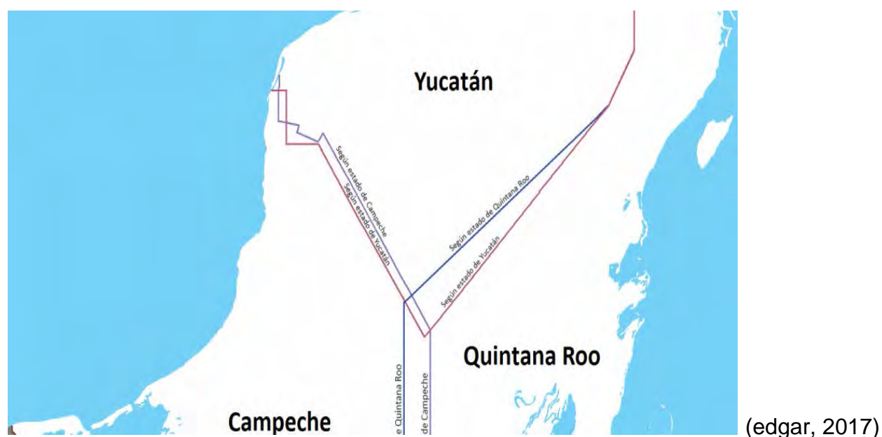
Figura 7: Mapa en el que se muestra la franja en conflicto limítrofe, que Quintana Roo perdió ante los Estados de Campeche y Yucatán.

En virtud de dicha resolución, es necesario señalar la forma en la que queda delimitado el territorio de Quintana Roo.