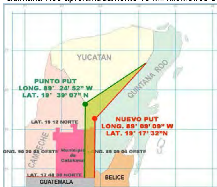
Figura 6: Mapa que muestra como ha quedado el nuevo punto Put al haber perdido Quintana Roo aproximadamente 10 mil kilómetros de extensión territorial.

La SCJN detalló que se han resuelto con anterioridad diversos recursos de reclamación tales como el 10, 11, 12, 13 y 15, todos de 2014-ca, promovidos respectivamente, por Estado de Yucatán; C, el Congreso del Estado de Campeche; Municipio de Holpechen, Estado de Campeche, derivados de la controversia 21/2014 presentada por el Estado de Quintana Roo por el conflicto de límites territoriales.