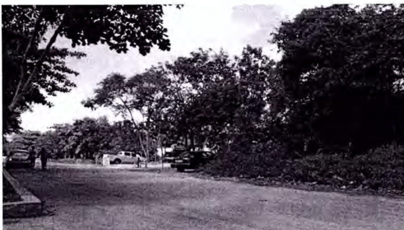
Imagen: Economía y agentes informales afectan el turismo

Según información de “La Jornada Maya”, los famosos “Jaladores” así como vendedores ambulantes continúan presentando un serio problema para los vendedores legalmente establecidos y que pagan impuestos de manera constante, en la que piden a las autoridades municipales atender este problema sobre todo en los alrededores de la zona arqueológica y Parque Nacional Tulum.