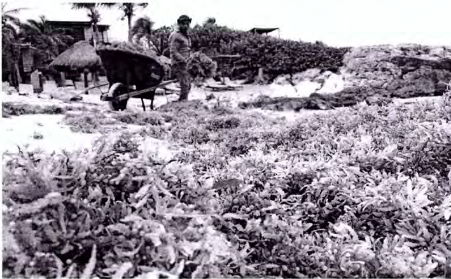
Imagen: Acciones para contrarrestar el impacto del sargazo.

Algunas acciones para solucionar este problema han las intervenciones de las autoridades estatales, junto con la Marina, junto con el municipio, junto con el personal de la zona arqueológica, o sea autoridades estatales, municipales y federales para la limpieza de las playas de la zona de Tulum porque evidentemente ha sido afectada”.