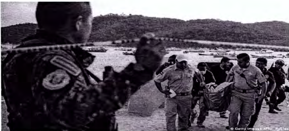
Imagen: Ejecución en las playas de México.

De acuerdo a Deutsche Welle, emisora internacional de periodismo, veinte de las playas más turísticas a lo largo y ancho de México sufren el mismo lastre en los últimos años. En Cancún se multiplicaron por 15 los asesinatos en los últimos cuatro años y ya figura entre la cincuentena de ciudades más violentas del planeta. Sigue sus pasos Playa del Carmen y en general toda la Riviera Maya, en el estado de Quintana Roo, donde el pasado año se duplicaron los homicidios.