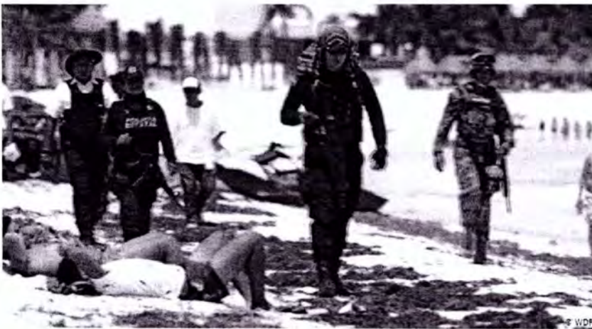
Imagen: Patrullaje en la zona de playa en Tulum.

También, se patrullan entre los bañistas varios militares y policías con fusil en mano, ataviados con las botas y chaleco antibalas reglamentario bajo un bochornoso sol. La Riviera Maya está pasando de ser un paraíso turístico a un paraíso del control y vigilancia, con la bandera de la seguridad. Esta media, al igual que la anterior, es cuestionada por parte de visitantes nacionales y extranjeros, ya que esta nueva forma de gestión de la seguridad, nubla y distorsiona las bellezas naturales propias de la zona.