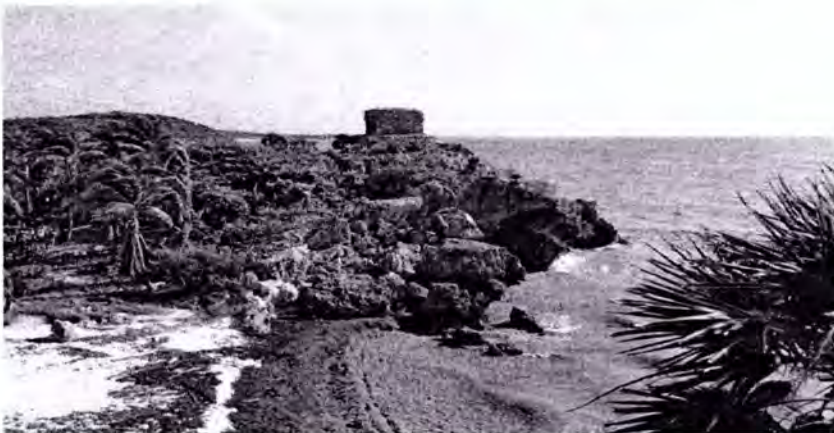
Imagen: El sargazo en la Zona Arqueológica de Tulum

Hoteleros invierten millones para limpiar playas, todos los días antes del amanecer, empleados de los hoteles comienzan su jornada en una lucha contra el tiempo para retirar el sargazo que llega a las playas durante la noche, y así, cuando el día empieza a clarear, los turistas no se percaten de un cambio en el paisaje. Sin embargo, de acuerdo con empresarios hoteleros, ocupar personal para realizar este trabajo les ha generado un gasto aproximado de entre 500,000 y tres millones de pesos mensuales. Así lo reporta su informe "Invasión de sargazo en el Caribe implica riesgo por cambio climático", el cual señala que el sargazo representa un riesgo inmediato y a largo plazo para el turismo mexicano, Como una medida para combatir el problema, hoteleros ya analizan bajar sus tarifas entre 15% y 20%. El sargazo estrangula algunas de las playas más queridas de México en cantidades cada vez más grandes, causando no solo hedor y monstruosidad, sino también daños a los arrecifes de coral y a los ecosistemas marinos.