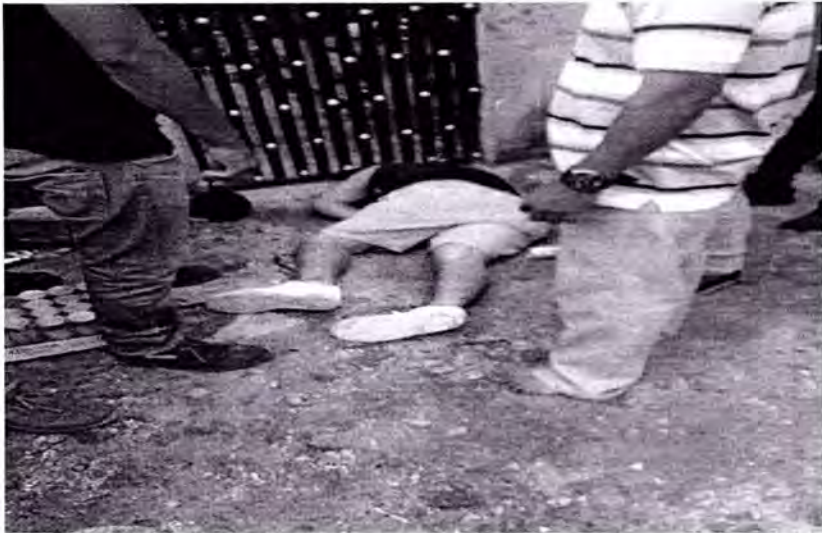
Imagen: La inseguridad y violencia en Tulum.