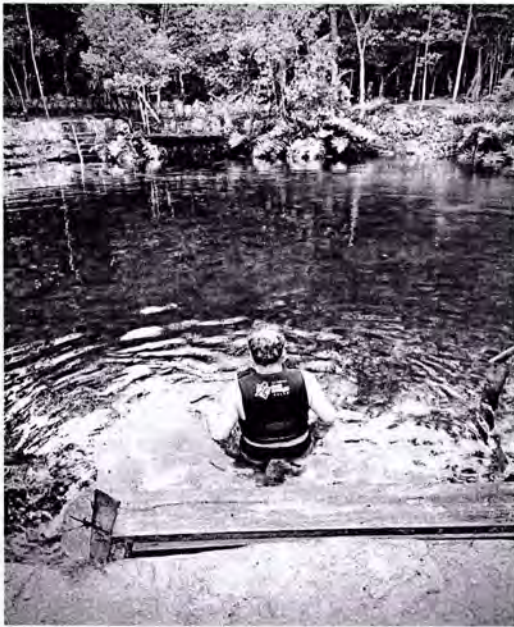
Imagen. Bellezas naturales de la zona