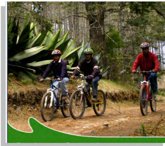
Imagen No. 1 Bicicleta de montaña

En la parte administrativa, asesore primeramente con la atención al cliente, di algunos tips que deben ser tomados en cuenta pero no fue muy necesario puesto que las personas internas como externas a la empresa son muy respetuosas y amables con los turistas. Trabajé en el mantenimiento del equipo de tirolesa y bicicleta de montaña además de ser guía. (Ver imagen 1 y 2)