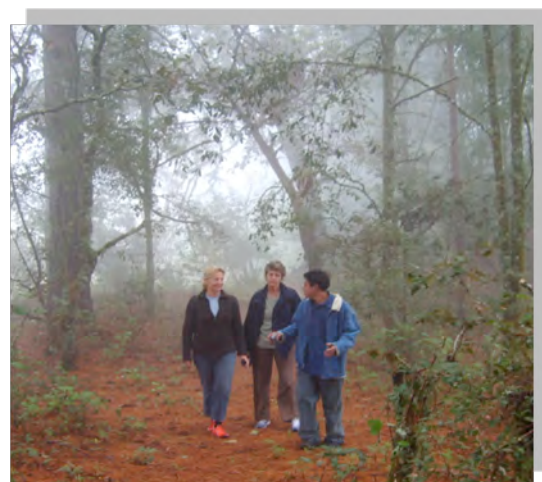
Imagen No. 2 Guía en el bosque