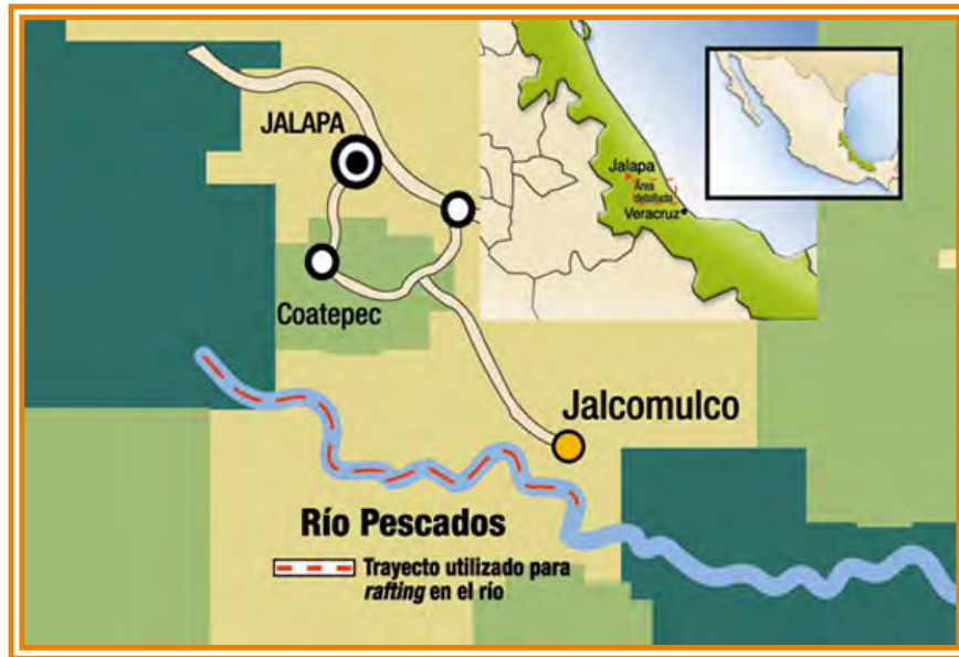
Fig. 3. Ubicación Geográfica de la localidad de Jalcomulco y el río pescados.

El río Antigua atraviesa por la comunidad de Jalcomulco (Fig. 4), cobrando gran importancia, pues debido a este la comunidad desarrolla su principal actividad económica que es el turismo. Actualmente con mayor cause el turismo Alternativo de Aventura.