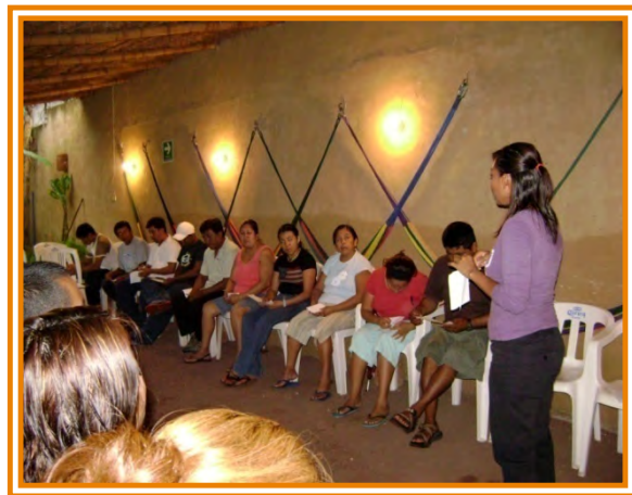
Fig. 8 Taller al personal de Aventuras Sin Límite.

Durante la estancia en Jalcomulco se pudieron realizar dos talleres. El primero fue un taller de manejo y control de grupos dirigido a todo el personal de la empresa, desde los guías de cada una de las actividades, personal de cocina, personal