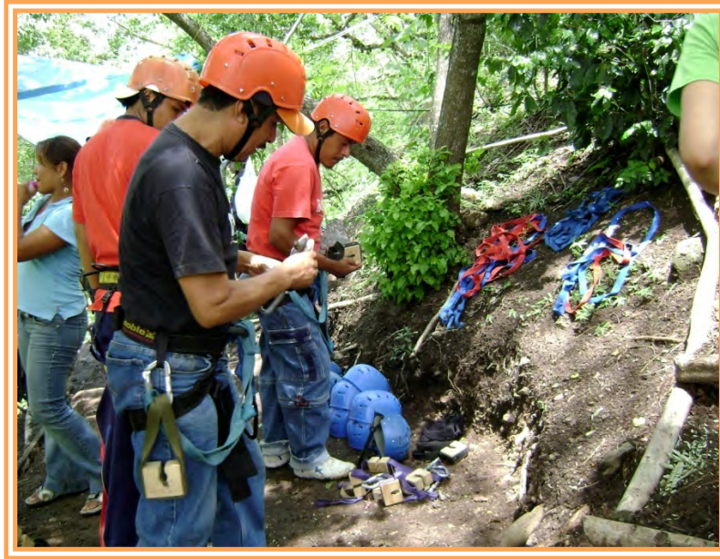
Fig. 10 Personal de la Empresa Organizando el Material de Tirolesa.

con las cintas se lograba disminuir la velocidad del recorrido a través de la línea de tirolesa.