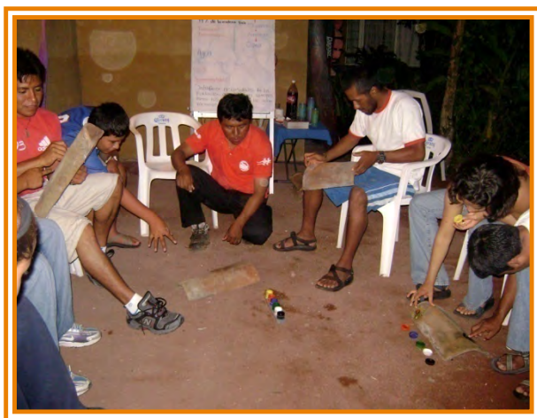
Fig. 9 Actividad del Taller de Cuidado al Ambiente.

El segundo taller que se presentó fue el de cuidado al medio ambiente cuyo objetivo fue crear conciencia ecológica en todo el staff de Aventuras Sin Límite (fig. 9). Se habló acerca de los medios de contaminación más comunes, se plantearon algunas alternativas para el reciclaje de los desechos