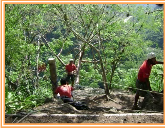
Fig. 7. Staff de Aventura Sin Límite realizando Rappel.

para revisar la línea (Fig. 7) y esperar abajo a los clientes que van llegando. Esto se hace para dar mayor seguridad a los turistas ya que en caso de que algunos de los clientes sufra algún incidente se pueda manejar adecuadamente, así de esta manera la persona que se encuentra en la parte inferior controla la cuerda y en dado momento detiene el descenso de la