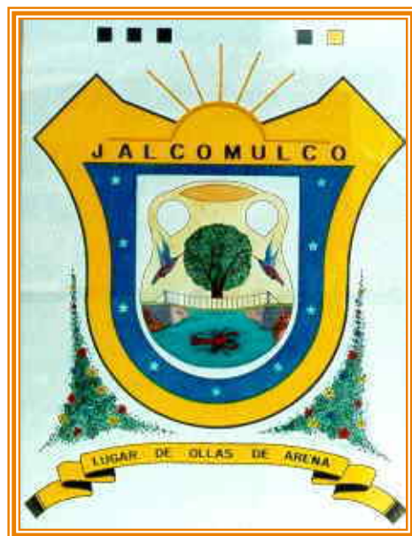
Fig. 1 Escudo de Jalcomulco

Jalcomulco se ubica en las coordenadas 19°20' de latitud Norte y 96°46' de longitud Oeste, a una altura de 389(msnm). Limita al norte con los poblados de: Emiliano Zapata; al este con Apazapan; al sur y suroeste con Tlaltetela; y al noroeste con Coatepec. Su distancia aproximada al sureste de la capital del Estado por carretera es de 28.5 Km.