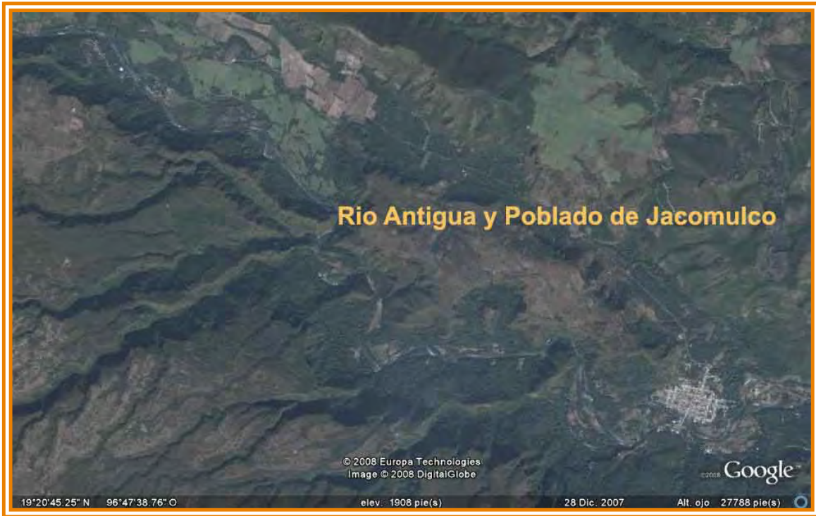
Fig.4. Rio Antigua a través del poblado de Jalcomulco.