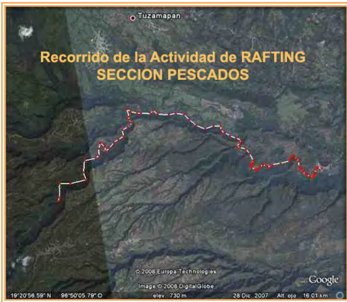
Fig. 6. Recorrido de la Sección Pescados.

Los rápidos más impresionantes de esta sección son: Pocito, Horroroso, Apazapan, La brujita, El presidencial y Las puertas del infierno.