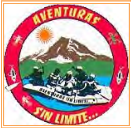
Fig. 5. Logotipo de la empresa Aventuras Sin Limite Expediciones.