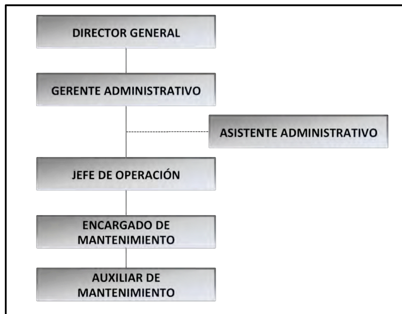
Figura 2.1 Organigrama de la empresa de Pericos Tours

La empresa Pericos Tours la podemos catalogar como pequeña ya que el número de empleados que posee es de 6, pero en la actualidad se tienen definidos los puestos que posee cada uno de estos. En la Figura No. 3.1 se presenta la estructura orgánica de la empresa.