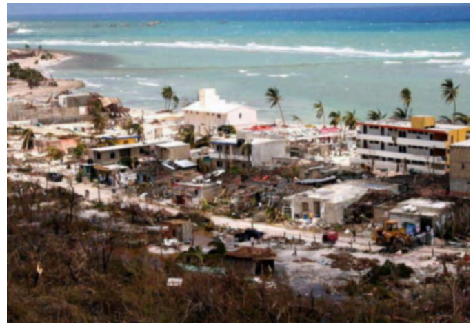
Foto 3. Daños en Mahahual por el huracán Dean