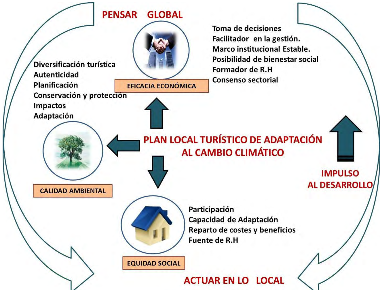
Esquema 2. Plan Turístico de Adaptación al Cambio Climático

energía eléctrica, así como la disminución de gases de efecto invernadero, son algunos ejemplos de iniciativas simples que se conectan con las dinámicas observadas en el sector.