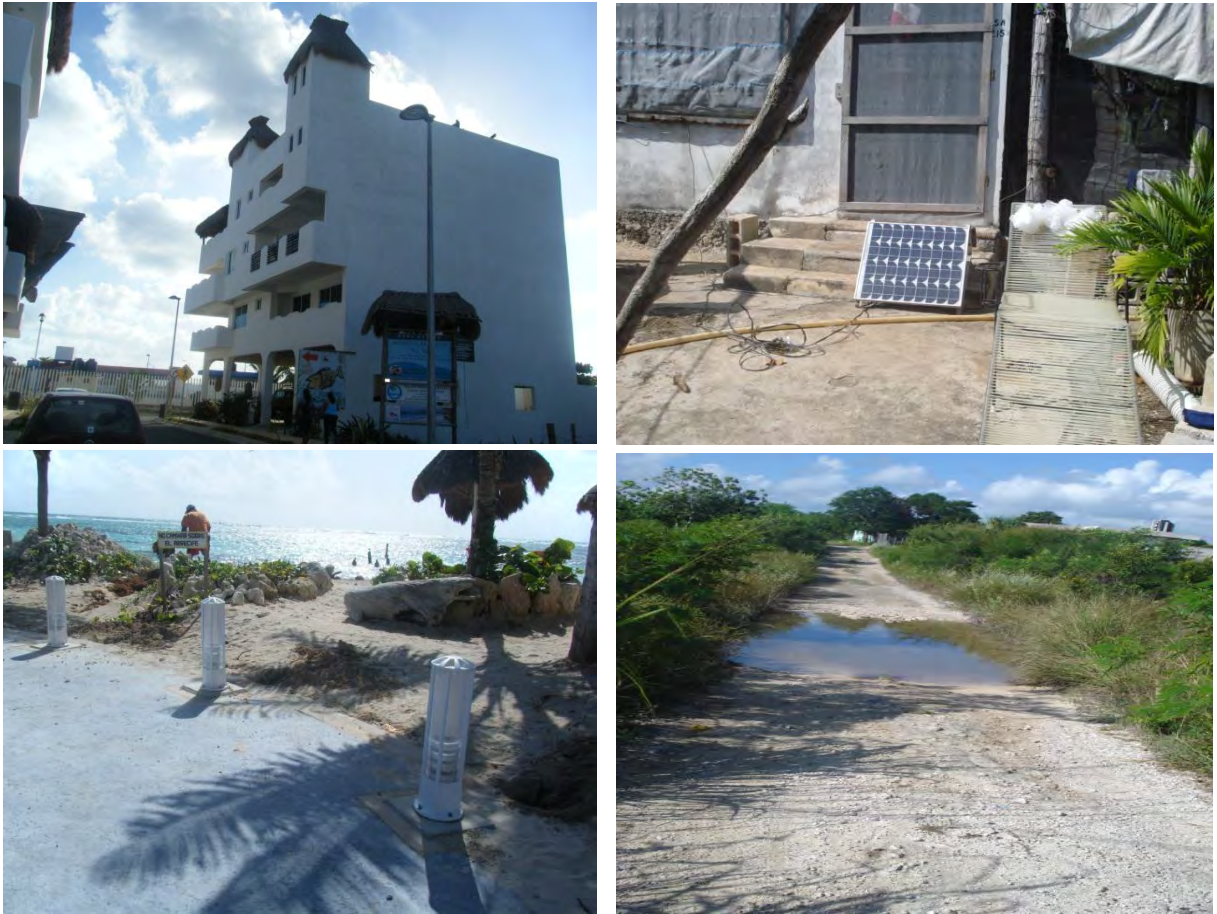
Foto 16. Contraste entre la zona turística y la población de Mahahual