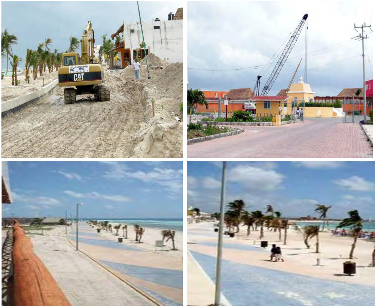
Foto 6. Renovación de Mahahual tras el paso del huracán Dean

Característicamente, la parte con mayor concentración turística se ubica a lo largo de la costa, en donde se han establecido espacios especializados para servicios a ofrecer a la gente que llega a este destino.