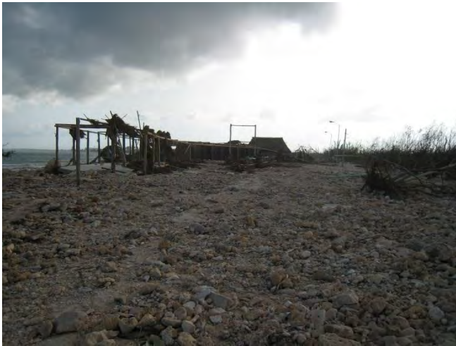
Foto 2. Daños en Mahahual por el huracán Dean

El crecimiento de Mahahual después del paso del huracán Dean, en 2007 como se puede observar en las siguientes fotos es indiscutible, es evidente el aumento tanto demográfico, como de infraestructura hotelera y servicios turísticos, ya que el gobierno federal cumplió con la recuperación y renovación del “Nuevo Mahahual”, con un presupuesto de 5.8 MDD, después de los daños causados por el huracán Dean (SECTUR, 2008).