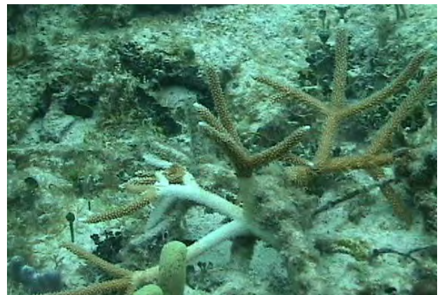
Foto 1. Blanqueamiento de una colonia de coral Cuerno de Ciervo ( acroporacervicornis ).

Las costas de Quintana Roo marca el inicio del Sistema Arrecifal Mesoamericano, segundo arrecife más grande del mundo después de Australia. Los arrecifes coralinos de Quintana Roo son Áreas Naturales Federales Protegidas (COP16, 2010). La situación climática del Estado de Quintana Roo radica en los destinos costeros, ya que se requiere analizar el peligro de los eventos extremos que surgirán, tales como la elevación del nivel del mar y la afectación que se está teniendo en los ecosistemas costeros, manglares, arrecifes y playas (PNUMA-SEMARNAT, 2004).