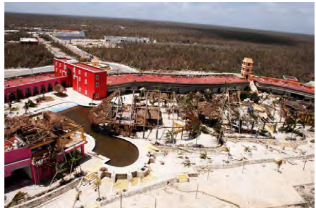
Foto 5. Infraestructura hotelera después del huracán Dean