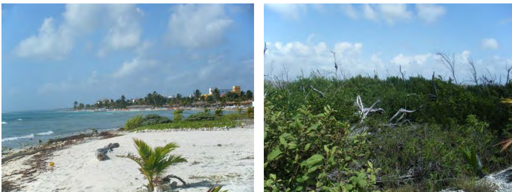
Foto 14. Erosión de la zona costera y recuperación del mangle

Desde el paso del huracán Dean y la destrucción del mangle, puede apreciarse una notable recuperación, sin embargo hay partes que requieren más tiempo, pero el avance que puede observarse es un gran paso. No obstante, en la parte costera se cuenta con apenas unos cuantos metros de playa debido a la desaparición de arena por distintos factores ambientales y cambio en la composición del mar por la construcción de hoteles y restaurantes cerca del límite de mar y playa.