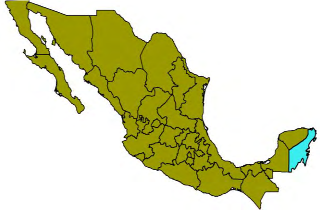
Figura 1. Mapa de México y Quintana Roo

El Estado de Quintana Roo se localiza en la Península de Yucatán en el Sureste de la República Mexicana en las coordenadas geográficas extremas al norte 21^{\circ}35' , al sur 17^{\circ}49' de latitud norte; al este 86^{\circ}42' , al oeste 89^{\circ}25' de longitud este. Colinda al norte con Yucatán y con el Golfo de México; al este con el Mar Caribe; al sur con la Bahía de Chetumal, Belice y Guatemala.