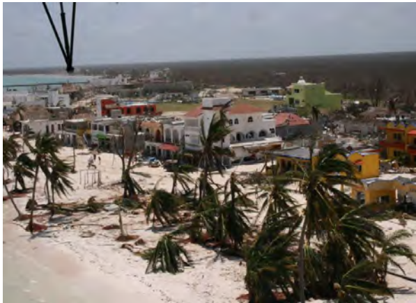
Foto 4. Costa de Mahahual tras el paso del huracán Dean