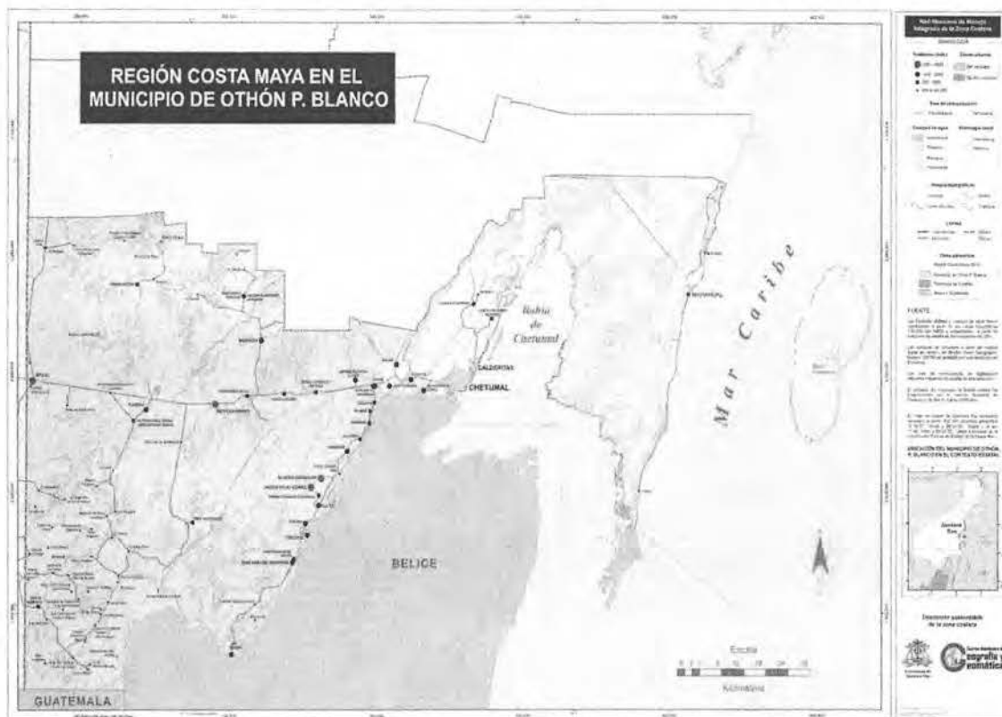
Figura 1. Ubicación Geográfica de la Región Costa Maya

El proyecto tiene por quehacer dos actividades. La primera, es la lotificación de la propiedad de 8 lotes destinados a albergar hoteles y tres lotes cuyos usos serán comerciales y de servicios, todos ellos para ofertar su venta a inversionistas, el segundo tiene como propósito la introducción de los servicios urbanos de vialidad, agua potable, drenaje, electricidad y telefonía. El proyecto Costa Maya, reivindica las pretensiones de los tres niveles de gobierno, para promover el desarrollo de esta zona, aprovechando el gran potencial turístico que tiene, justificándolo como el equilibrio que se necesita para