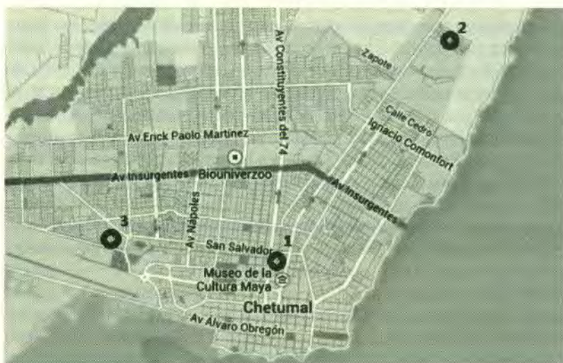
Mapa 1. Ubicación de los centros de culto a la Santa Muerte

La ciudad de Chetumal se localiza en el sur del estado, en la frontera internacional con Belice. Si bien hay al menos diez centros de culto a la Santa Muerte, en este trabajo se presentan tres casos, que por su actividad y tradición se encuentran entre los más representativos. El centro de culto marcado con el número 1 es el único de carácter eclesial, mientras que los otros dos son altares domésticos.