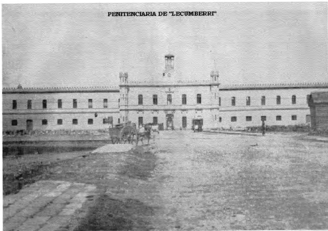
PENITENCIARIA DE "LECUMBERRI"