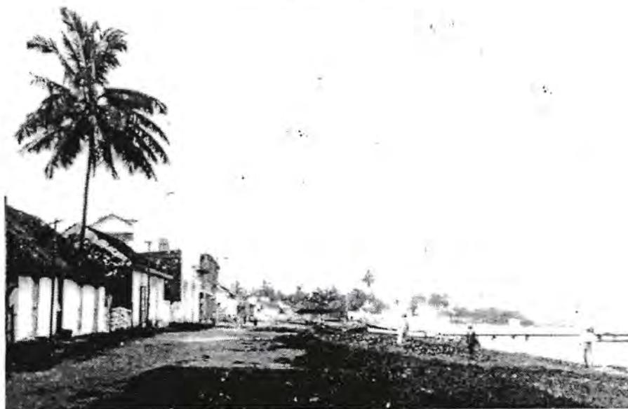
Foto 3. Malecón

En cuanto a la vivienda, las casas eran de techo de palma (Ver Foto 3), unas cuantas de cal y canto, y su poblado principal sólo tenía dos calles regulares, mismas que hoy en día son conocidas como la Avenida Rafael E. Melgar y la Quinta Avenida.