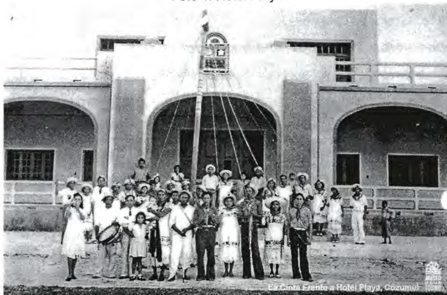
Foto 4. Hotel Playa