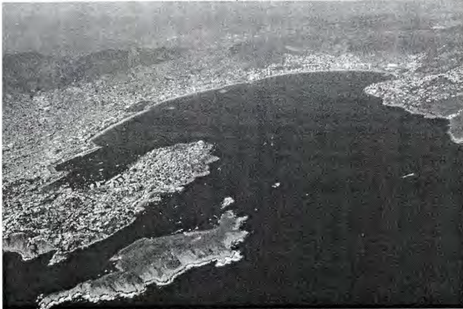
Foto 2. Acapulco 2006

sociales provocadas por el crecimiento urbano acelerado y desordenado alrededor de los centros turísticos, el deterioro del entorno ecológico y la pérdida de la identidad cultural” (Ibíd.:52)