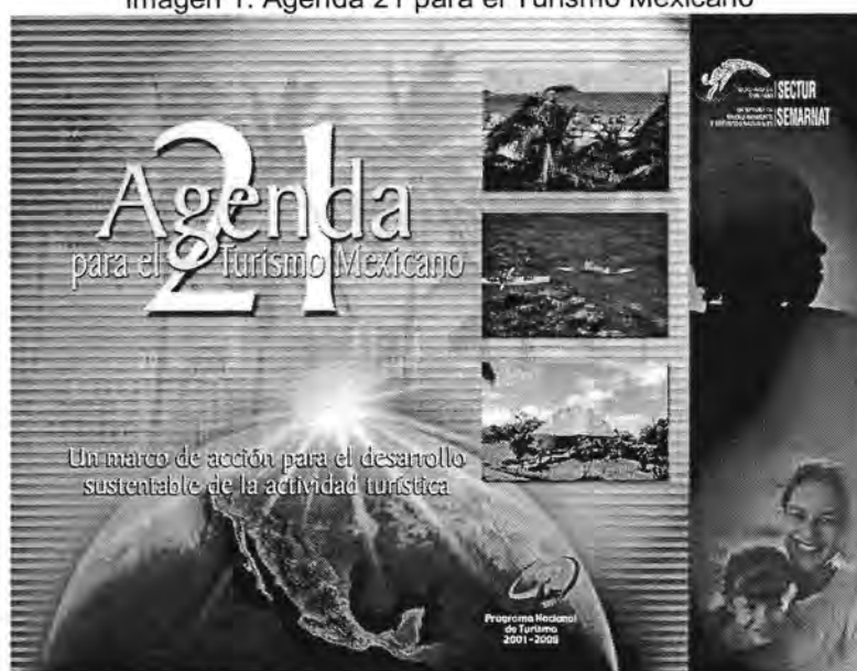
Imagen 1. Agenda 21 para el Turismo Mexicano

El 27 de noviembre de 2002, en Sian Ka'an, Quintana Roo se presenta ante el Presidente de la República Vicente Fox Quesada la Agenda 21 para el turismo mexicano (Ver Imagen 1) diseñada por la Secretaria de Turismo y la Secretaria de Medio ambiente y Recursos Naturales, en la que para alcanzar un desarrollo sustentable de la actividad turística, se definen las acciones entre los actores locales, estatales y federales.