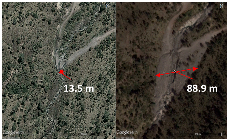
FIGURA 3. Evidencia de erosión causada por flujos a 3 350 msnm, PNPO. Punto central de ambas imágenes: 19.081676° N 97.253860° O. Imagen a la izquierda, 21 de mayo de 2011, imagen a la derecha, 1° de marzo de 2014 (Google Earth®, 2015).

El promedio de la precipitación acumulada durante el evento, basado en el registro de 48 estaciones dentro de un radio de 75 km del PNPO, fue de 99.5 mm con una desviación estándar de 63.3 mm. Los totales de precipitación de las estaciones localizadas en altitudes por debajo de 2 500 msnm no han sido significativamente distintos a los de las ubicadas por encima de 2 500 msnm, con un promedio de 97.9 y 106.2 mm, respectivamente. Sin embargo, se notó una fuerte