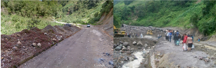
FIGURA 7. (Izquierda) Paso a Tetelcingo, Coscomatepec, en la barranca del río Tliapa a 1920 msnm, previo al huracán Ernesto (Google Street View, julio de 2012). (Derecha) Mismo paso después del huracán Ernesto (Facebook/tetelcingo.coscomatepecveracruz, 2012).

msnm, ensanchándola y profundizándola en varios tramos (figuras 2, 3, 5 y 6). Al llegar a las partes bajas de la cuenca el río Jamapa, con fuertes escurrimientos y con los materiales erosionados ladera arriba incorporados, ocasionó importantes daños a la infraestructura de comunicaciones de Coscomatepec y Calchualco (figura 7).