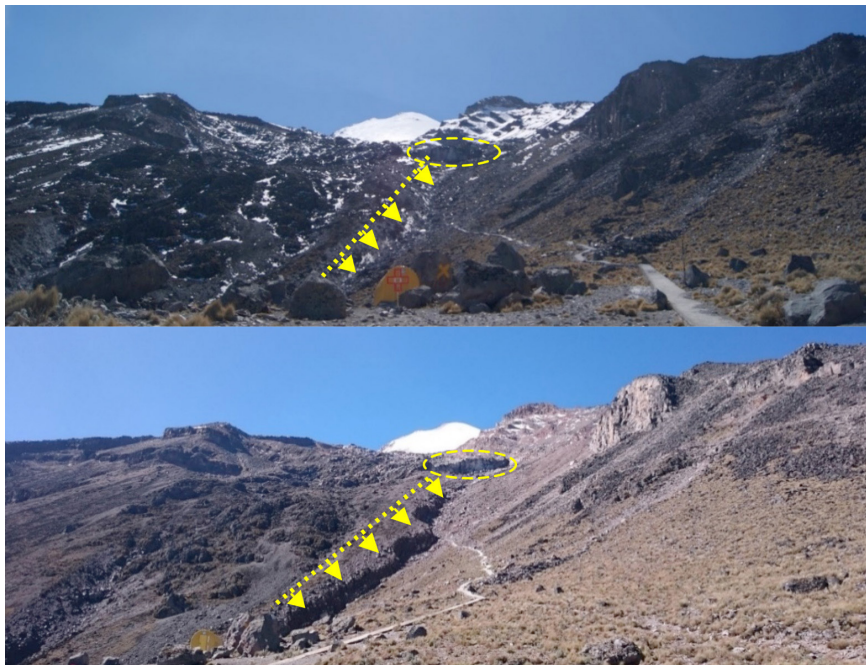
FIGURA 6. Evidencia de erosión y remoción en masa con una barranca, pasando de 8.5 a 18.5 m de ancho y de 2 hasta de 5 a 10 m en la parte baja de la imagen (marcado por la línea amarilla) y un escarpe a 4 400 msnm, PNPQ. La barranca se formó dentro de la rampa de la morrena glacial descrita por Palacios y Vázquez-Selem (1996, p. 15). Otra evidencia fotográfica restringe el evento de haber ocurrido entre marzo de 2012 y enero de 2013. Foto superior, diciembre de 2011, foto inferior, agosto de 2015, ambas tomadas por Morales.

constantemente a la corriente principal del Jamapa. Aun así, por arriba de los 4 000 msnm hay evidencia de procesos de remoción en masa a causa de agua (figura 6), y por arriba de esta altitud solo existe el intermitente flujo de agua proveniente del glaciar Jamapa en la cara norte del Pico de Orizaba.