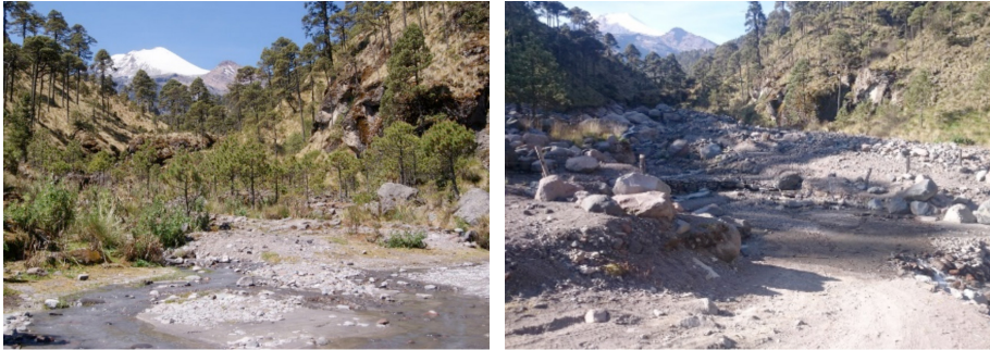
FIGURA 2. Evidencia de la modificación del cauce de río y los depósitos asociados al evento. Fotografía a la izquierda, mayo de 2011 (Galán, 2011), anterior al evento, y fotografía a la derecha, junio de 2014 (Morales, 2015), posterior al evento, a 3 350 msnm, PNPO.