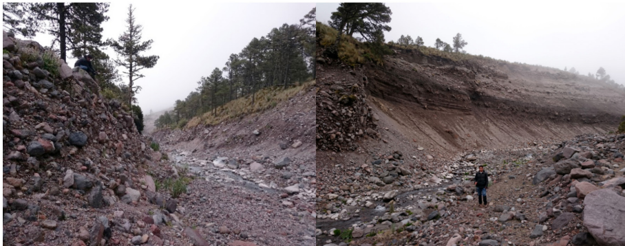
FIGURA 5. Aspecto de las barrancas considerablemente profundizados durante el evento hidrometeorológico. Imagen izquierda Lat. 19.067147°N Lon. -97.256864°O a 3 809 msnm, imagen derecha Lat. 19.070749°N Lon. -97.254669 a 3 753 msnm.