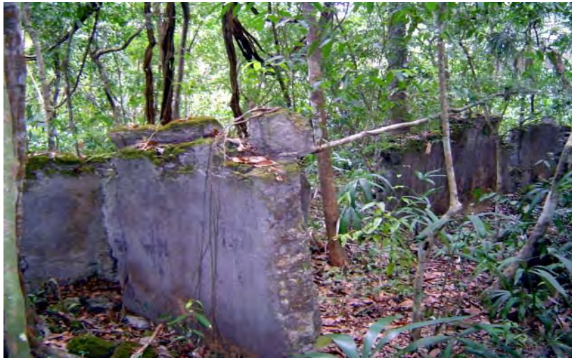
CONACULTA-INAH-MEX; "Reproducción Autorizada por el Instituto Nacional de Antropología e Historia", Restos de casa-habitación de Chichanhá. Fotografía 6, de Celcar López Rivero.