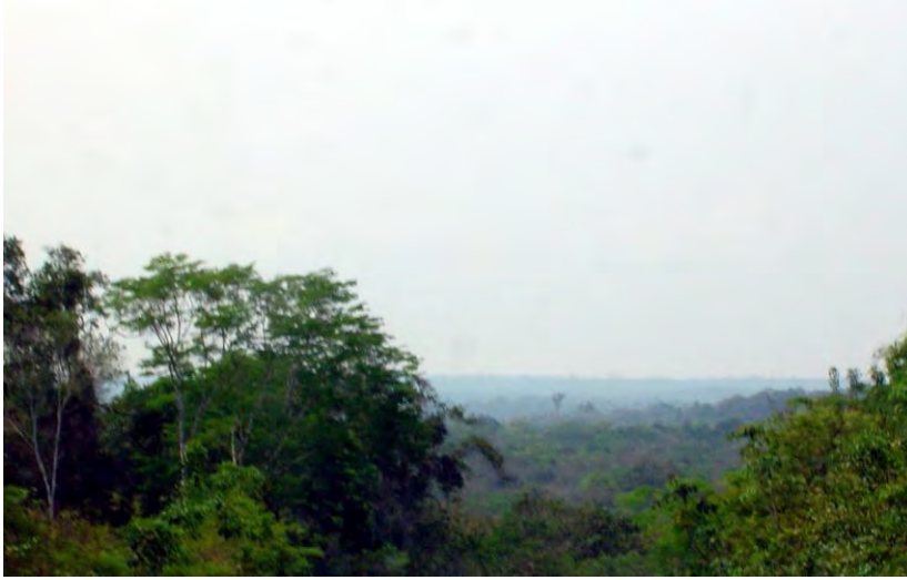
CONACULTA-INAH-MEX; "Reproducción Autorizada por el Instituto Nacional de Antropología e Historia", Chichanhá al interior de la selva quintanarroense. Fotografía 1, de Jorge Gamboa.