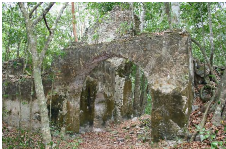
CONACULTA-INAH-MEX; "Reproducción Autorizada por el Instituto Nacional de Antropología e Historia", Restos de la portada y atrio de la iglesia-convento de Chichanhá. Fotografía 3, de José Gabriel Ramos Carrasco.