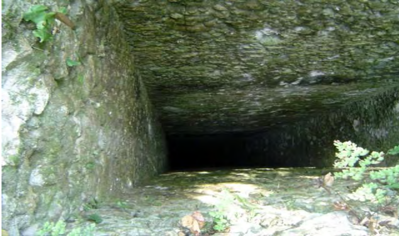
CONACULTA-INAH-MEX; "Reproducción Autorizada por el Instituto Nacional de Antropología e Historia", Red Hidráulica, para la población civil de Chichanhá. Fotografía 5, de Celcar López Rivero.