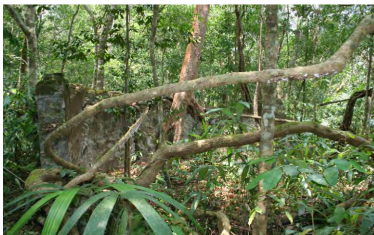
CONACULTA-INAH-MEX; "Reproducción Autorizada por el Instituto Nacional de Antropología e Historia", Restos de una segunda casa habitación de Chichanhá de planta ovalada y destruida al interior de la selva en el sur de Quintana Roo. Fotografía 4, de José Gabriel Ramos Carrasco.