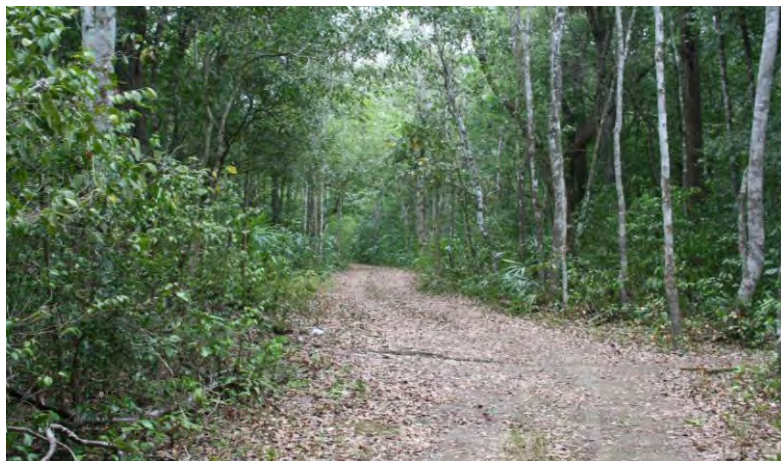
CONACULTA-INAH-MEX; "Reproducción Autorizada por el Instituto Nacional de Antropología e Historia", Camino para llegar a Chichanhá. Fotografía 2, de Jorge Gamboa.