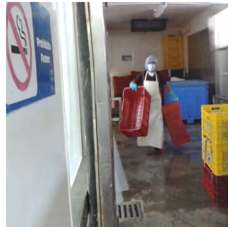
Ilustración 17 El producto listo para ser transportado.