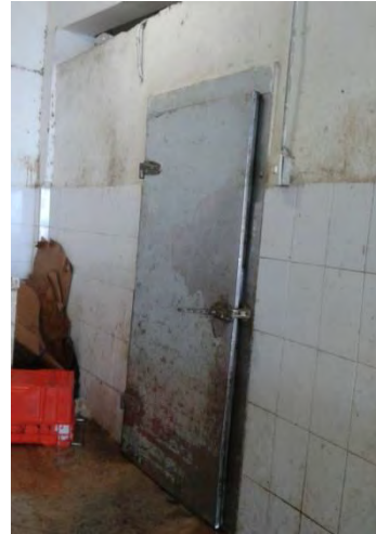
Ilustración 34 Congelador.