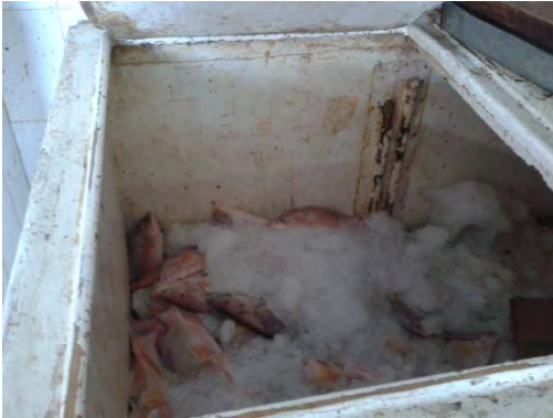
Ilustración 33 Nevera.