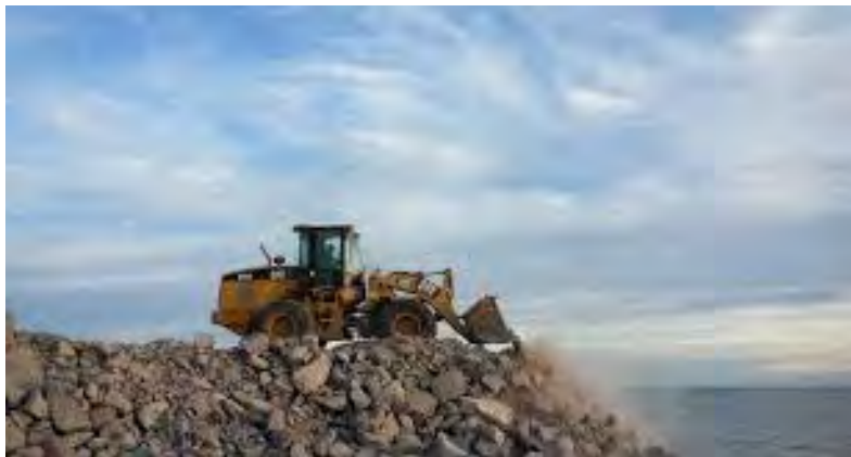
Ilustración 5 contaminación