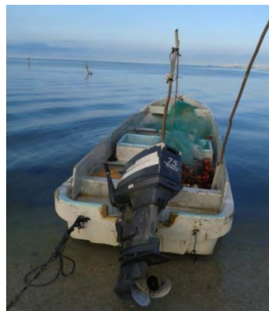
Ilustración 9 Lancha con motor, red y neveras.