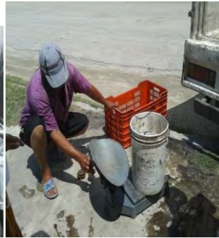
Ilustración 39 Pesando el producto obtenido.