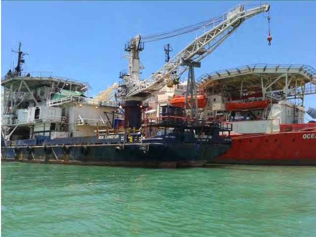
Ilustración 25 Barcos Petroleros.