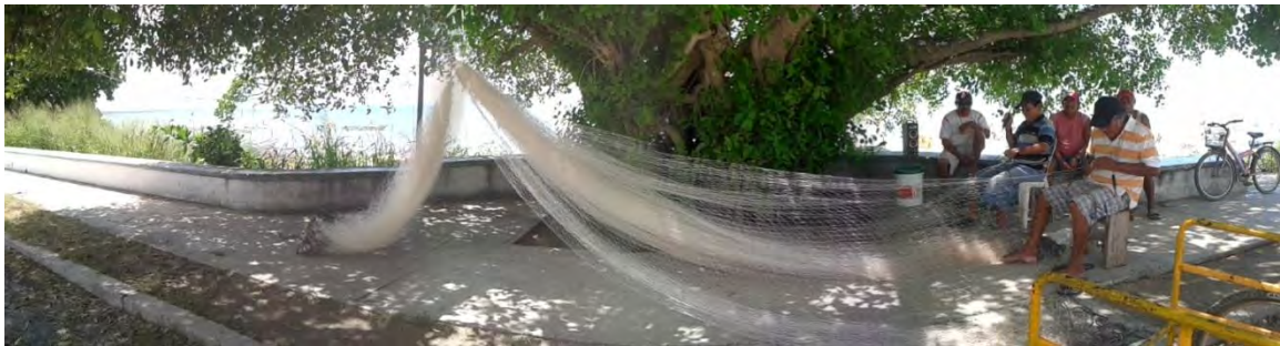
Ilustración 12 Frente común.