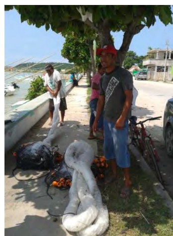
Ilustración 10 Juan