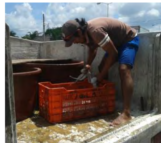
Ilustración 23 Pasando el producto a las neveras con hielo.