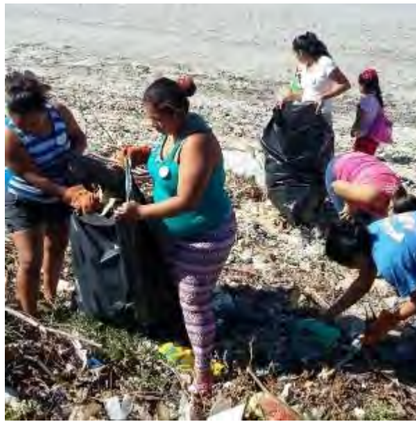
Ilustración 28 Proyectos contra la contaminación.