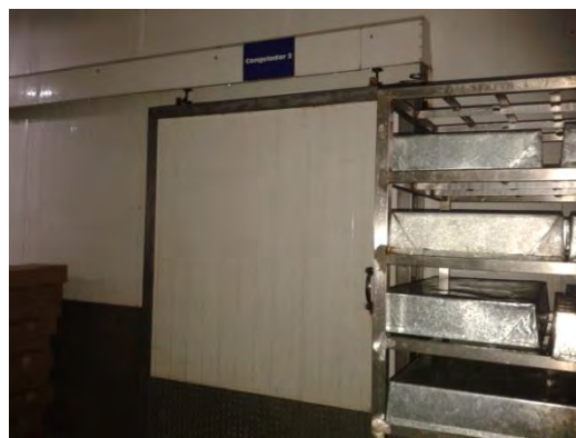
Ilustración 25 Congelador