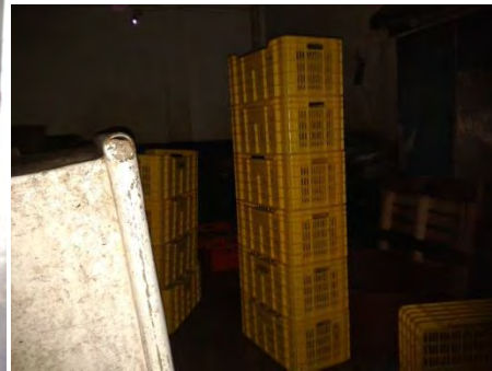
Ilustración 22 Dentro del Congelador.