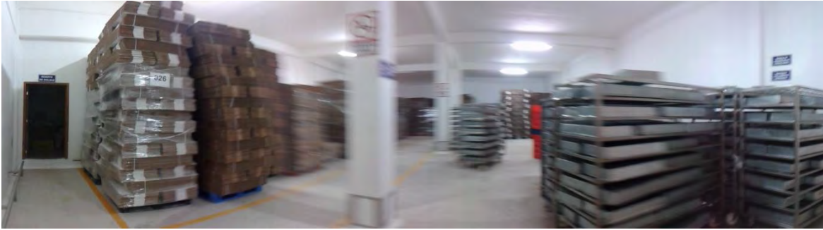
Ilustración 19 Bodega de charolas y cajas.