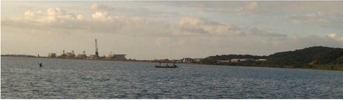
Ilustración 24 Puerto de Altura y Cabotaje.