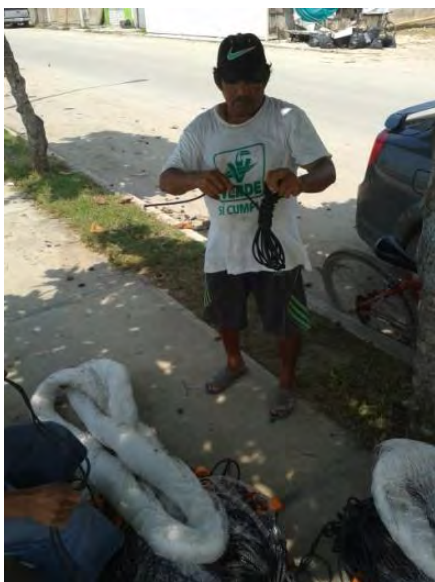
Ilustración 10 pescador