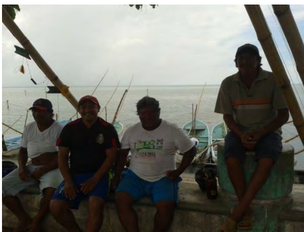
Ilustración 9 pescadores ribereños