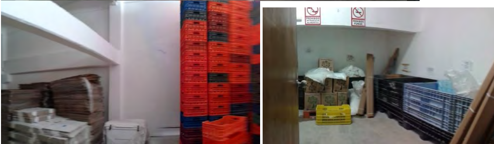
Ilustración 20 Bodega de los huacales y cartones.