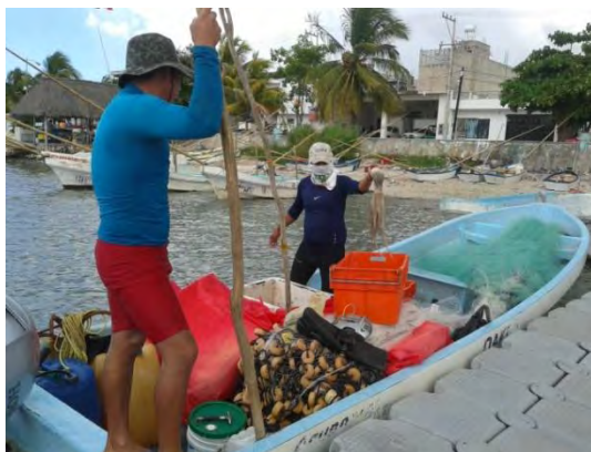
Ilustración 18 Buceadores de pulpo.