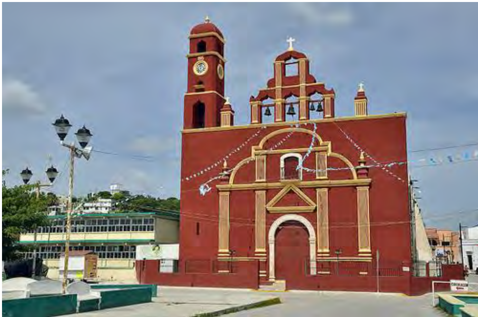
Ilustración 3 Iglesia de la asunción en Seybaplaya.