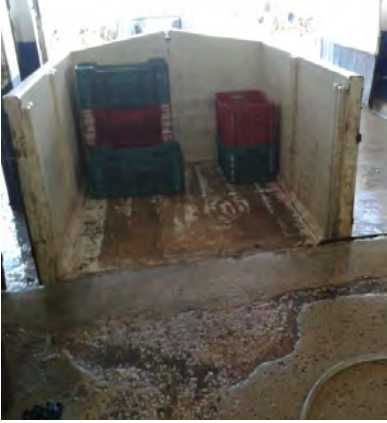
Ilustración 36 Transporte.