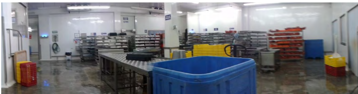
Ilustración 14 Área de acomodación