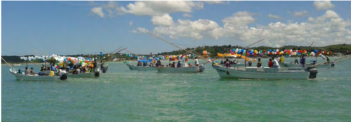
Ilustración 26 Paseo de la virgen de la asunción en lancha con los pescadores.