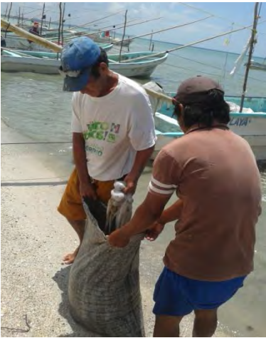
Ilustración 38 Pescadores libres con pulpo.