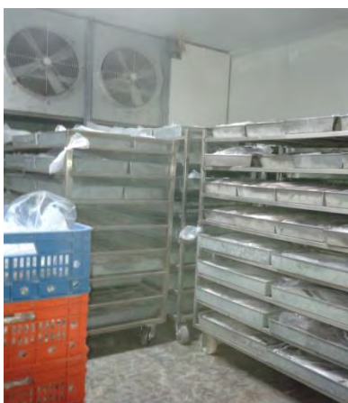
Ilustración 15 Dentro del Congelador