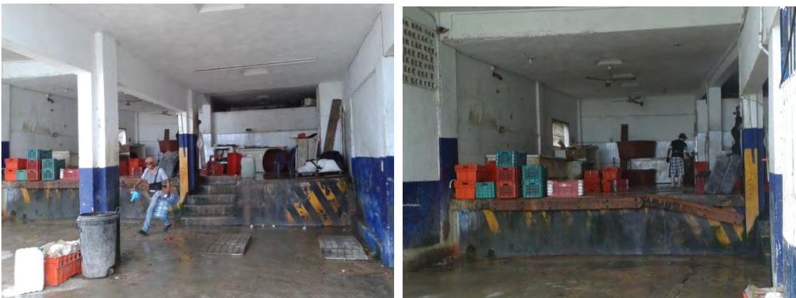
Ilustración 21 Cooperativa, "El Tucho".