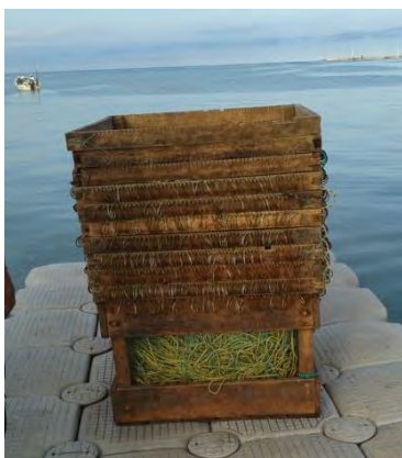
Ilustración 17 Palangre.