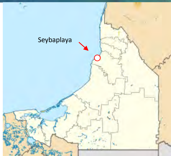
Ilustración 1 Seybaplaya