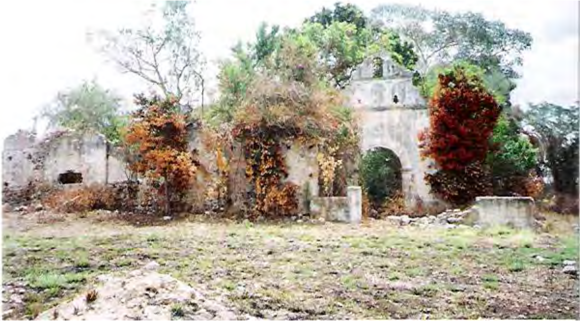
Ilustración 2 Seyba Cabecera