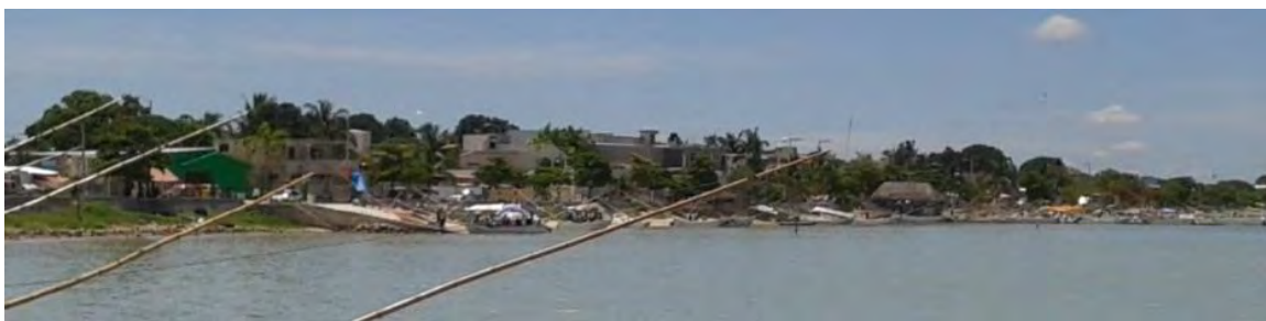
Ilustración 6 Lugar social