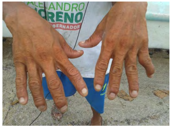
Ilustración 11 Manos de pescador