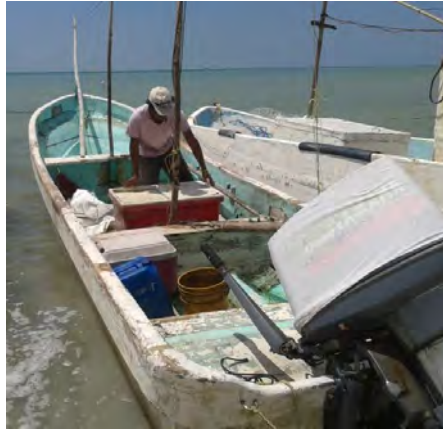
Ilustración 37 Pescador libre.