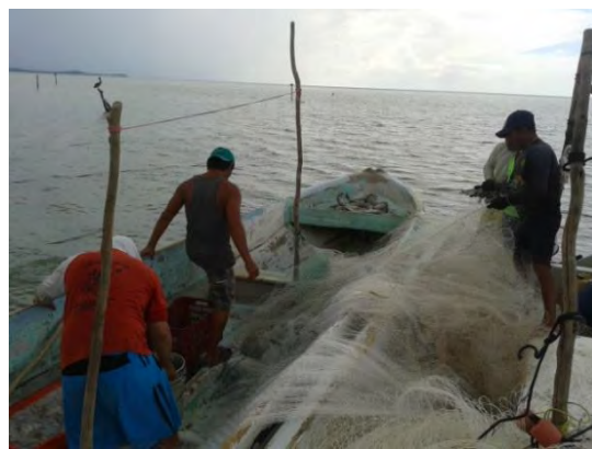
Ilustración 14 pescadores ribereños