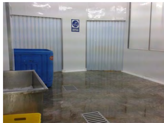
Ilustración 13 Lavadero y destripador de la Cooperativa "Congeladora, Salomón".