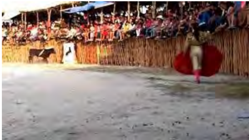
Ilustración 27 Corrida de toros