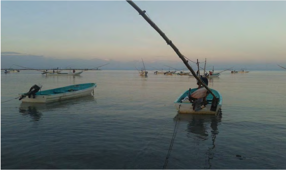
Ilustración 4 Pesca Ribereña