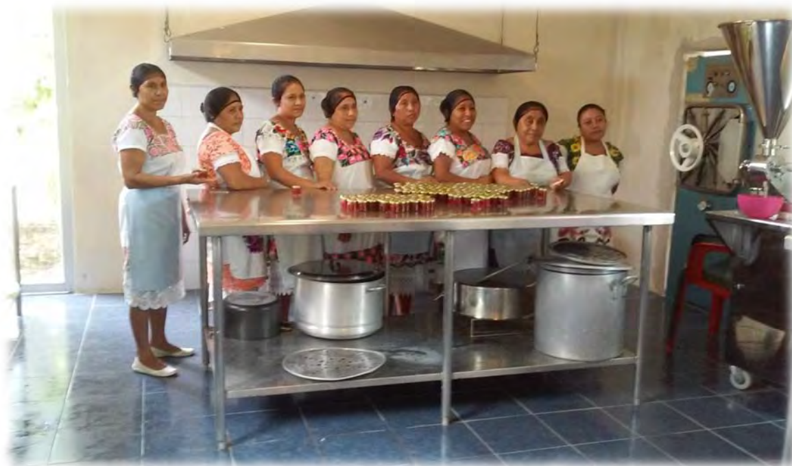
Integrantes de UL'UMIL BEH