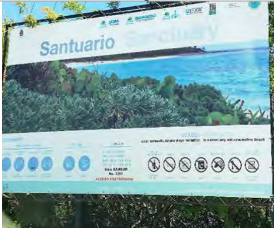
Imagen 1. Señalamientos en la zona de acceso al área.