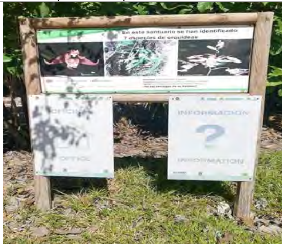
Imagen 5. Señalamientos de identificación de la flora presente en el área.