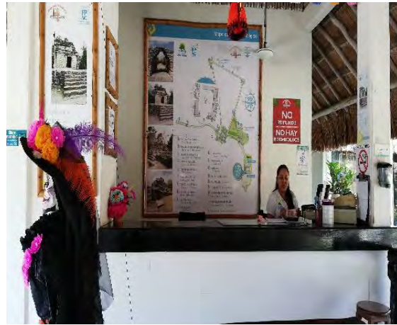
Imagen 2. Caseta de cobro para el ingreso del parador, operada por la FPMC.