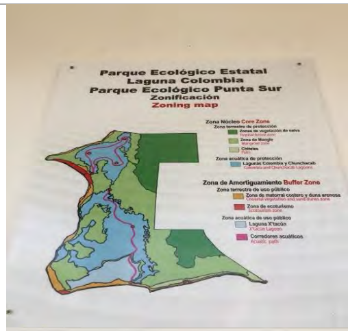
Imagen 4. El sitio cuenta con el mapa de zonificación que indica los estados en que se encuentra cada espacio del área.