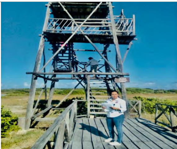
Imagen 3. Torres de avistamiento de aves.