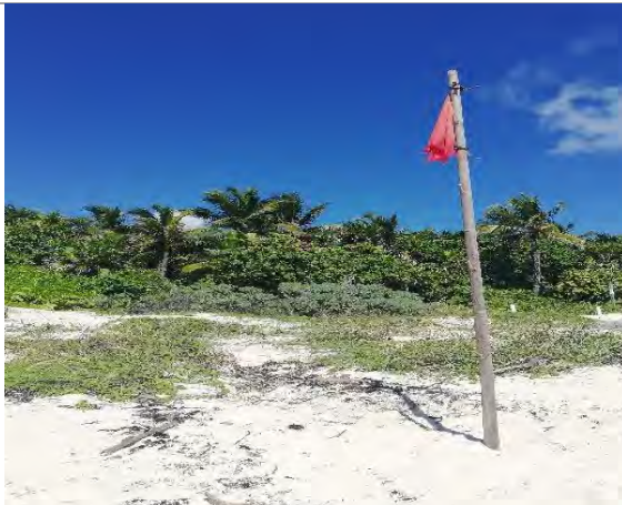
Imagen 3. Señalización usada para indicar las zonas permisibles para uso recreativo.