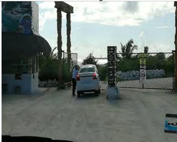
Imagen 1. Caseta de acceso con diversos señalamientos.