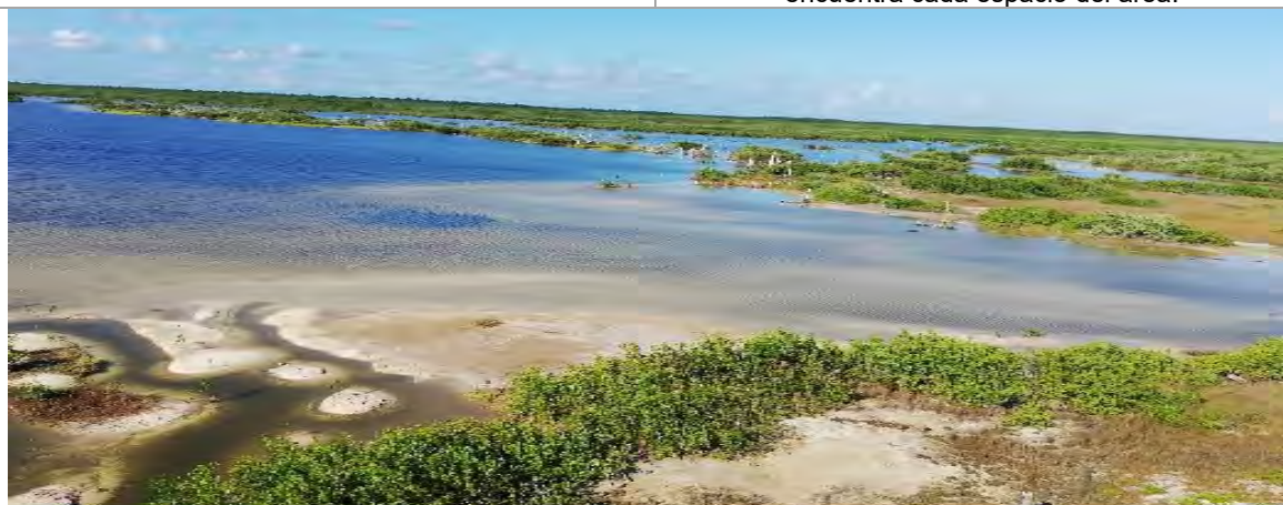
Imagen 5. Vista de las lagunas Xtacum y Colombia desde la torre de avistamiento, se observó la rehabilitación del manglar.