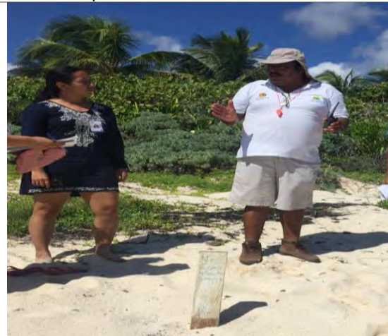
Imagen 6. Entrevista con encargados del ANP.