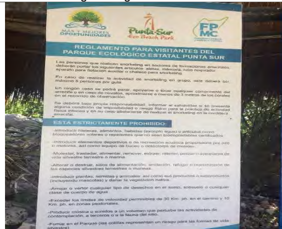
Imagen 2. Reglamento para visitantes.