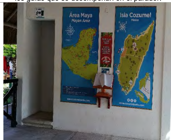
Imagen 6. Mapas informativos.