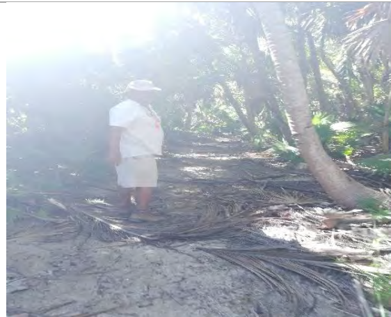
Imagen 4. Senderos sin operatividad y vigilancia que se encuentran en el área.