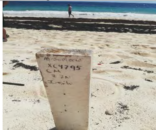
Imagen 2. Señalización de los lugares en que se encuentran los sitios de anidación.