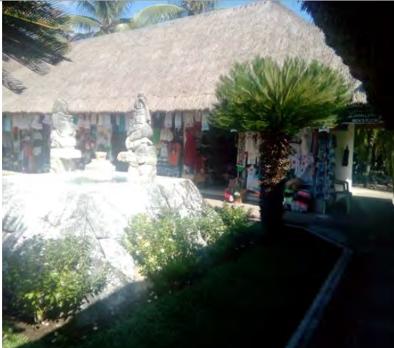
Imagen 3. Locales comerciales operando en las instalaciones del parador.