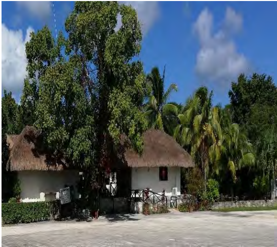
Imagen 1. Entrada al Parador Turístico de San Gervasio.

Evidencias fotográficas de la visita al Área Natural Protegida “Selvas y Humedales de Cozumel”