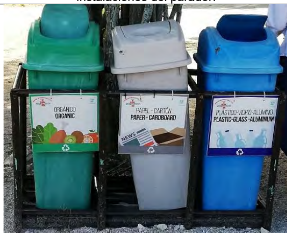
Imagen 5. Contenedores de basura que permiten la clasificación de los Residuos.