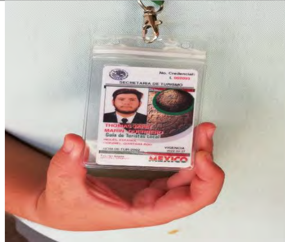
Imagen 4. Fotografía de las credenciales que portan los guías que se desempeñan en el parador.