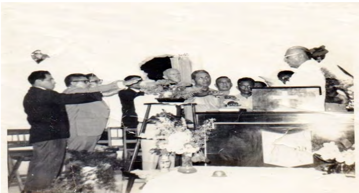
Las primeras ceremonias