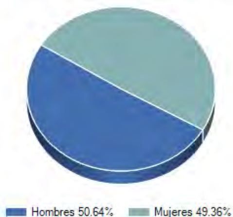
Distribución de la población por Sexo, 2010

Si comparamos los datos de Felipe Carrillo Puerto con los del estado de Quintana Roo concluimos que ocupa el puesto 5 de los 8 municipios que hay en el estado y