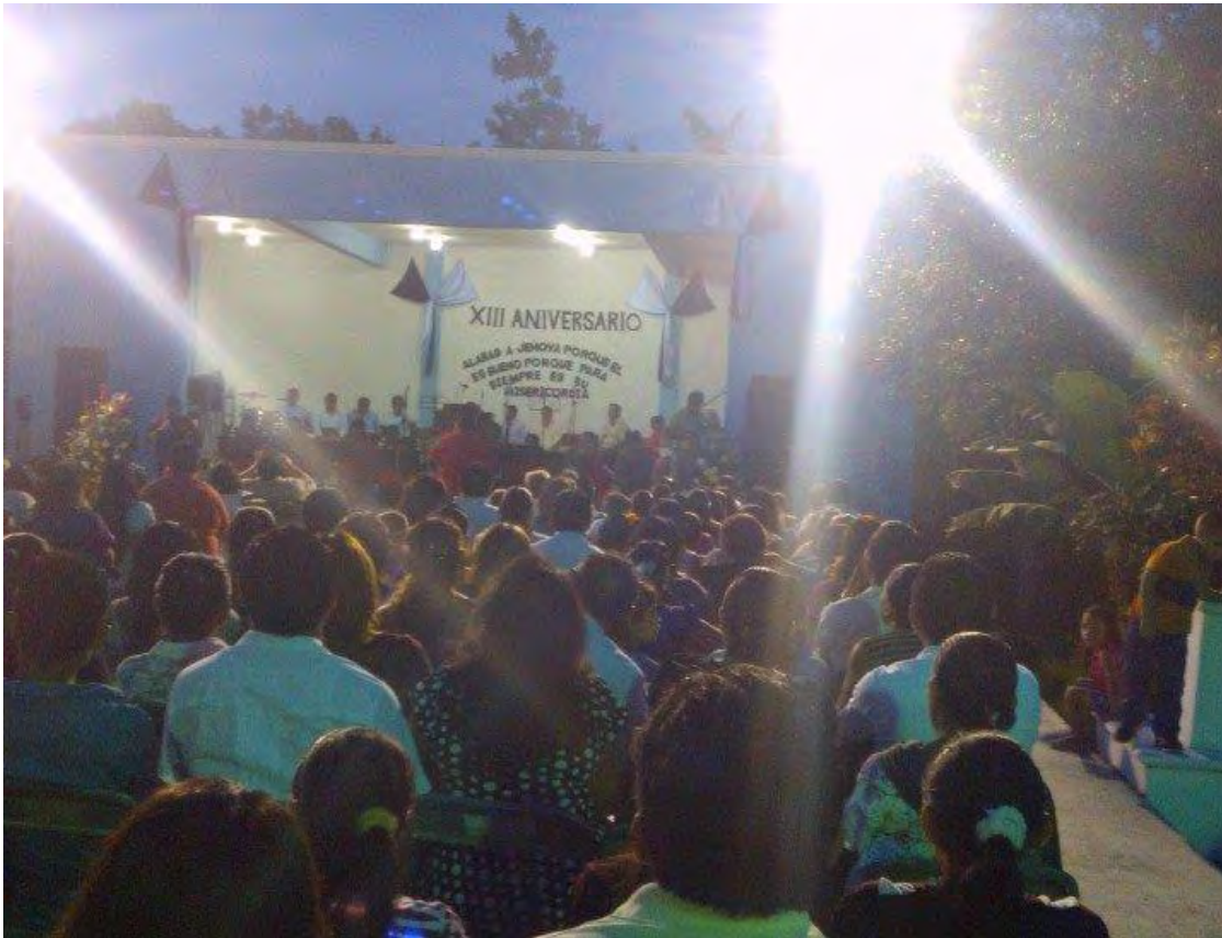
Culto unido la nueva Jerusalén, FCP; 2014

La dinámica fuera de los miembros de la iglesia presbiteriana, fuera de sus respectivas denominaciones de templo mantiene una identidad que va más allá de ser parte de la iglesia, sino en una forma de expresión ideológica.