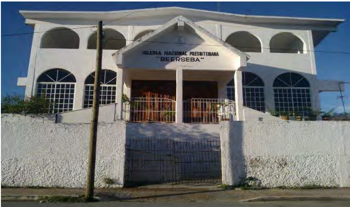
Iglesia en la actualidad