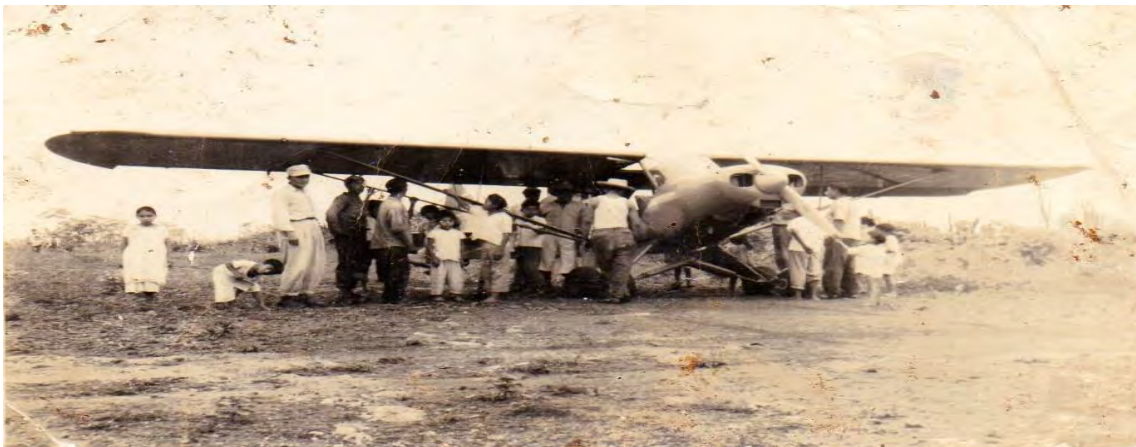
FCP, R, H