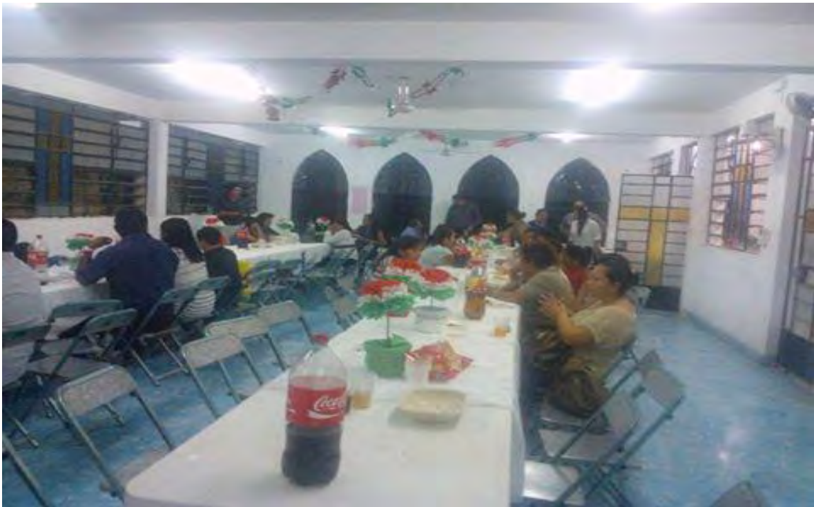
F.C.P, Félix C.C. 2014

El pastor exhorta a la población cada vez que estos eventos surgen a que la población no sea participe, pues según él esto sería una ofensa para Dios mismo, en sus predicaciones.