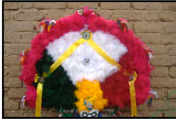
Penacho del grupo de la Danza de la Pluma "Teotzapotlan"

El modelo de los penachos es seleccionado por el maestro y los alumnos en el caso de la parte de enfrente, en el caso de la parte de atrás va de acuerdo con elección de los colores del danzante.