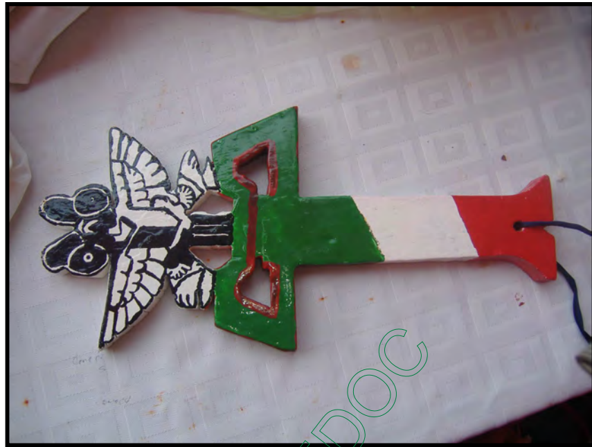
Mascara del negrito hecho de madera