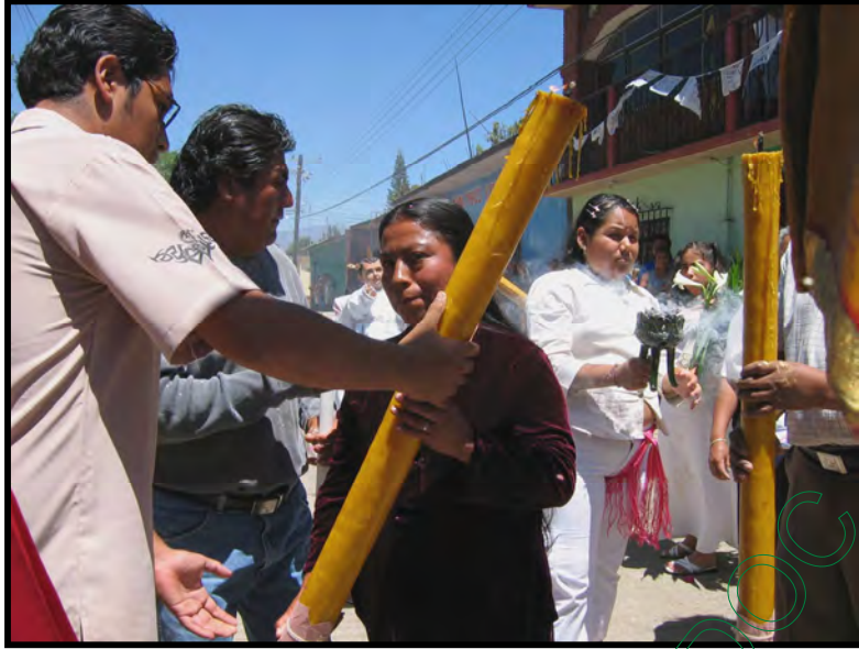
Mayordoma recibiendo el cirio para la festividad de Capilla de San José Patriarca 2006