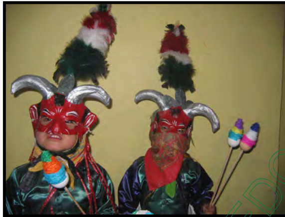
Diablitos en la festividad de San José

Los niños o jóvenes son quienes se disfrazaron de diablos algunos ya cuentan con sus trajes o en su caso lo alquilan en las casas particulares. Para esta ocasión hacen su arribo a la capilla como alrededor de las cuatro de la tarde.