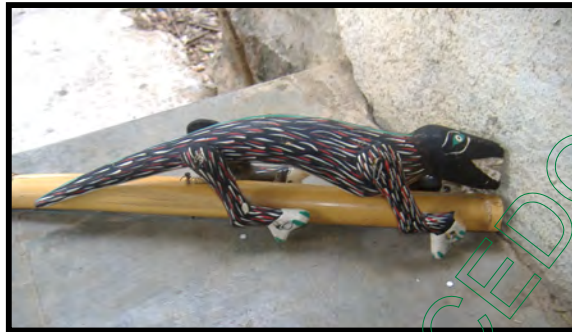
Chinchete utilizado por el negrito o campo

Negrito o Campo. Su vestimenta consta de una camisa blanca de manga larga con un chaleco negro que le cuelgan listones de colores, el pantalón negro con unos listones blancos a un costado de las piernas, en las manos llevan mascadas blancas. En la cara lleva una máscara negra que junto a la boca tiene dos cuernos y un sombrero de rayas blancas y negras que le cuelgan unos listones de colores y dos espejos uno por la parte de enfrente y el otro en la parte de atrás. Durante su presentación en la Danza de la Pluma carga un “chinchete” que es una vara de carrizo que en la punta tiene una lagartija de color negro.