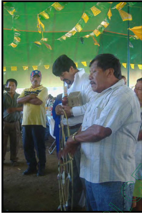
Mayordomo recibiendo el “cariñito” festividad de San José

De igual manera llegaron al lugar del gasto la hermandad y el comité juvenil de la capilla de San José, llevando un “cariñito” que les obsequiaron a los mayordomos. Fueron recibidos y se realizó el mismo ritual que es bailar el jarabe del valle, en este caso a la hermandad se le obsequió un “cariñito” por parte de los mayordomos.