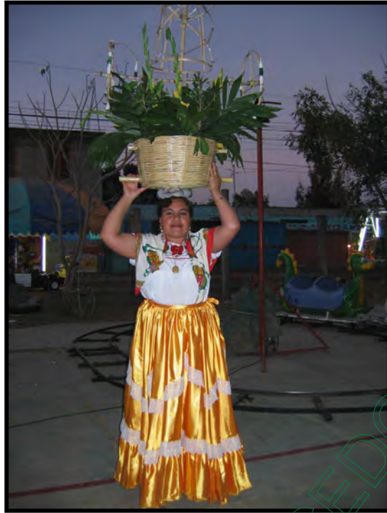
China Zaachileña con canasto pirotécnico festividad de San José

Una vez reunidos los que participaron en La Calenda, inició el recorrido; pasando por la calle Teotzapotlan inició la ejecución de las danzas. En su caso, los zacundos hicieron su presentación en los lugares donde se reúnen los habitantes para ver pasar La Calenda que podría ser una esquina de la calle. Del mismo modo, los grupos de la Danza de la Pluma ejecutaron algunas danzas; en lo que respecta a las chinas zachileñas, que cargaban las canastas con fuegos pirotécnicos, bailaron mientras se iban quemando los fuegos contenidos en la canasta. Cabe mencionar que La Calenda pasa por el panteón de la Villa, y los grupos de la Danza de la Pluma en señal de duelo bajaron sus penachos y se pararon por unos minutos frente a la puerta principal mientras la banda de música interpretó el “Dios Nunca Muere”; en seguida La Calenda pasó por las gradas que están frente al teatro 600 Años de Zaachila para presentar las danzas, ya que los habitantes de la Villa se reunieron en este lugar para presenciar La Calenda. Continuando con el recorrido se pasó al Municipio ya que fueron recibidos por el presidente municipal, la presidenta del DIF y los regidores.