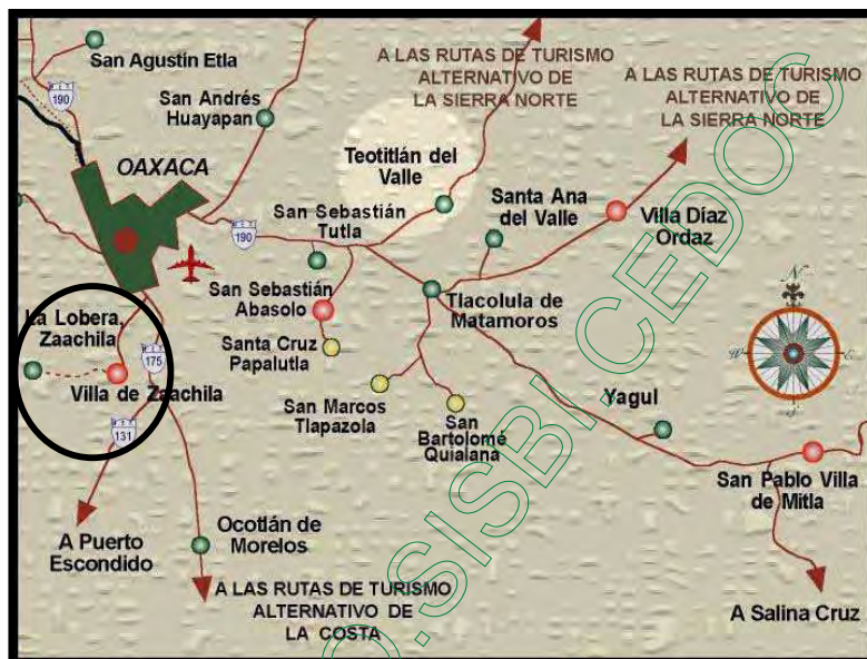
Mapa 1. Ubicación de la Villa de Zaachila, Zaachila. Oaxaca