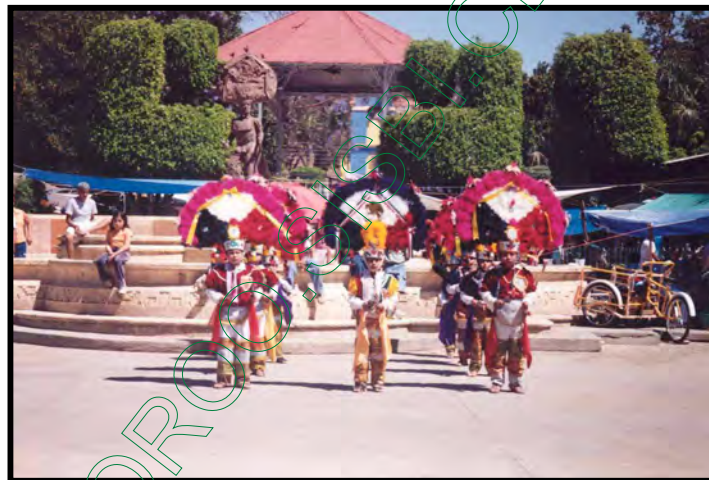
Grupo infantil de la Danza de la Pluma

La Danza de la Pluma forma parte de su cultura, al seguir reproduciendo la danza en las festividades religiosas y de esta manera por que se identifican con este elemento que forma parte de su identidad como colectivo. Retomando a Coronado (2003:258-270): “a pesar de que las danzas están relacionadas más con lo ritual debido a que se presentan en los momentos de las celebraciones religiosas, no hay que catalogar a las danzas en este ámbito, hay que analizar más a fondo, ya que las danzas pueden ser un reflejo de las transformaciones que ha sufrido un colectivo” , lo cual se puede apreciar en la historia que refleja la Danza de la Pluma.