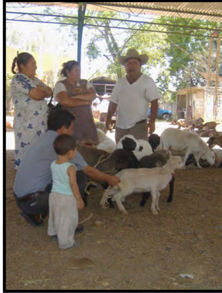
Señor vendiendo chivos y borregos en el baratillo