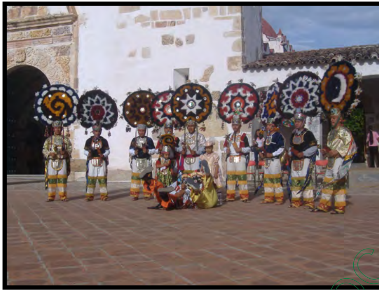
Danza de la Pluma de la localidad de Teotitlán del Valle