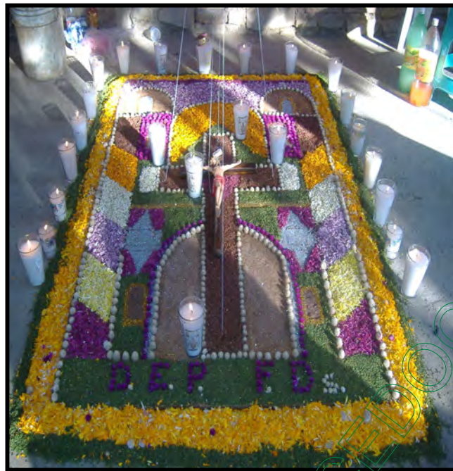
Tapete elaborado con flores de la imagen del Jesucristo.