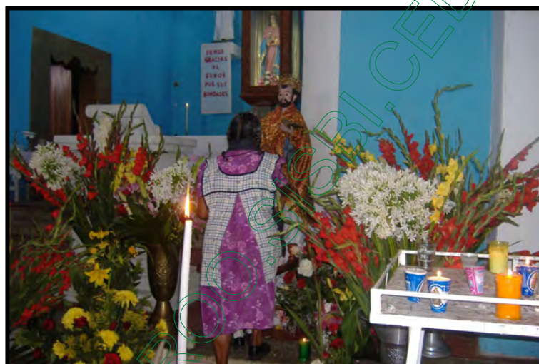
Festividad del Apóstol San Pedro

Cabe señalar que las fechas de las festividades de barrio no son fijas; y se celebran los domingos del mes de febrero y marzo. Con respecto a las festividades de capilla la celebración varia de acuerdo a la fecha, es decir, sí la fecha del santo coincide con un día entre semana, la celebración se adelanta un fin de semana antes de la fecha del santo. La festividad del santo de capilla o de la patrona del pueblo puede durar hasta tres semanas, iniciando con el convite que es el recorrido que hacen los integrantes del comité de festejos de la fiesta a celebrar, a siendo un recorrido por las principales calles del pueblo acompañados por niños que cargan un carrizo, señoras y señores. Para anunciar que la festividad comenzará, al día siguiente del convite inician las novenas, para continuar con la celebración se realiza La Calenda 13 , la noche de castillo o fuegos artificiales, el gasto de la mayordomía y los juegos deportivos.