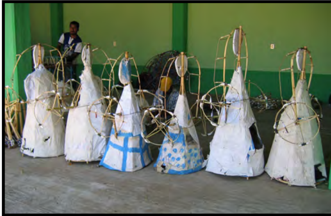
Muñecas con fuegos pirotécnicos para el día de La Calenda