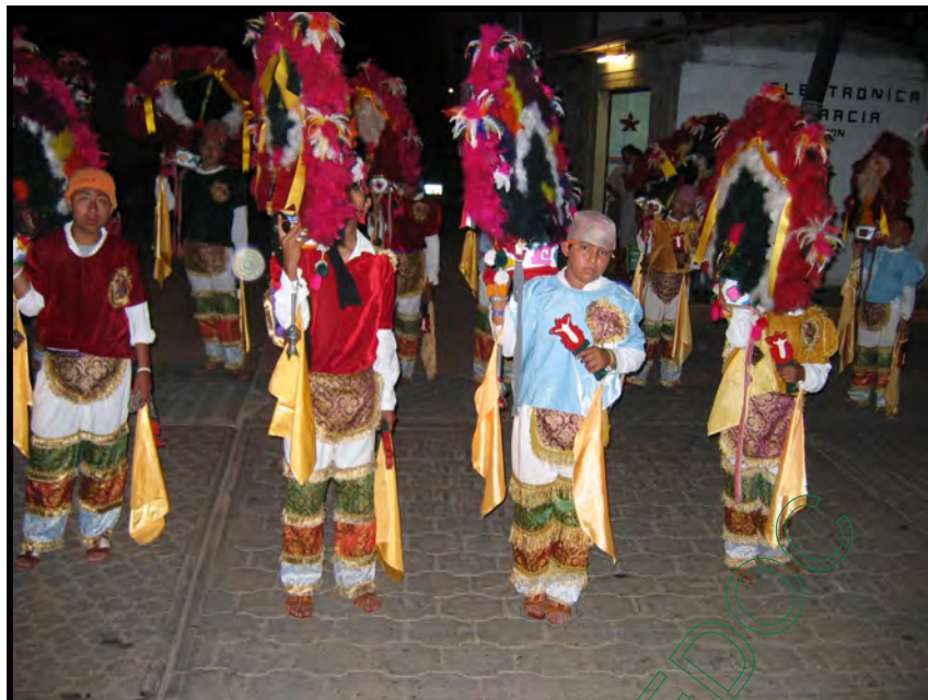
Grupo de la danza juvenil “Pitao Pezee” en La Calenda de San José, frente al panteón municipal.