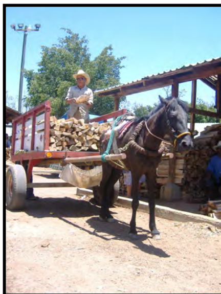
Carreta en el mercado de leña