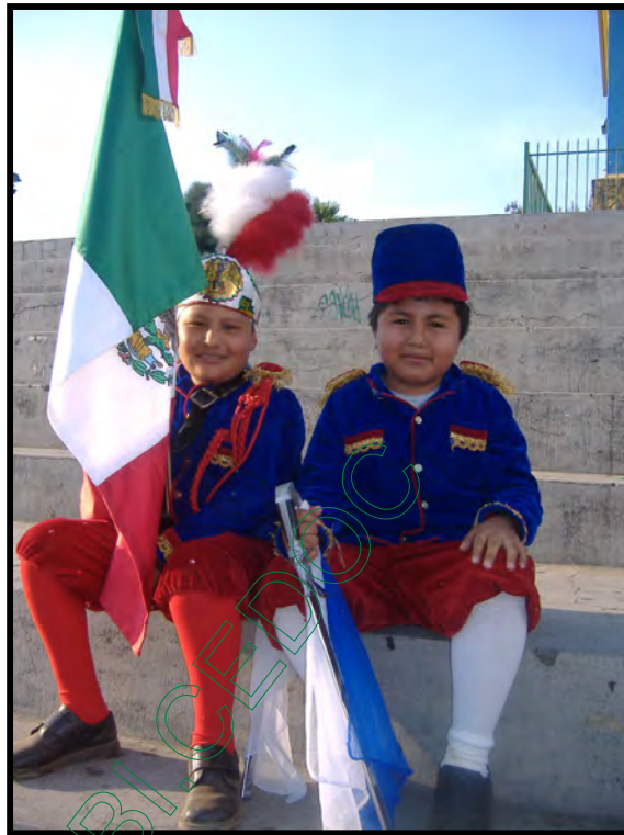
Grupo de danza “Teotzapotlan” desayunando en la casa del Mayordomo