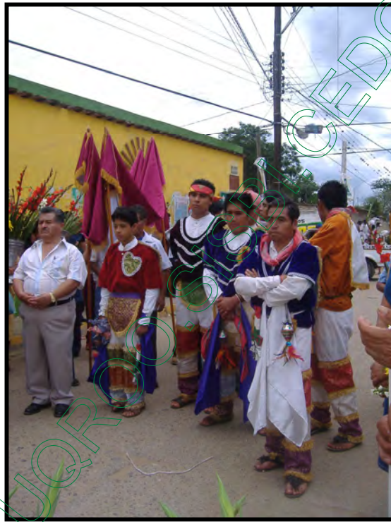
Grupo “Teotzapotlan” en la festividad de San Pedro

Existen tres formas de manilla, siendo de corazón o de azucena, de un águila y del dibujo de un búho (dios zapoteco). Esto depende del grupo de danza; en el caso del grupo “Teotzapotlan” la forma de la manilla es un Búho que representa el dios de la noche. En la cabeza llevan un pañuelo para ajustar el penacho ya que a veces les queda un poco grande. Calzan huaraches de cuero o también llamados cacles de pie de gallo.