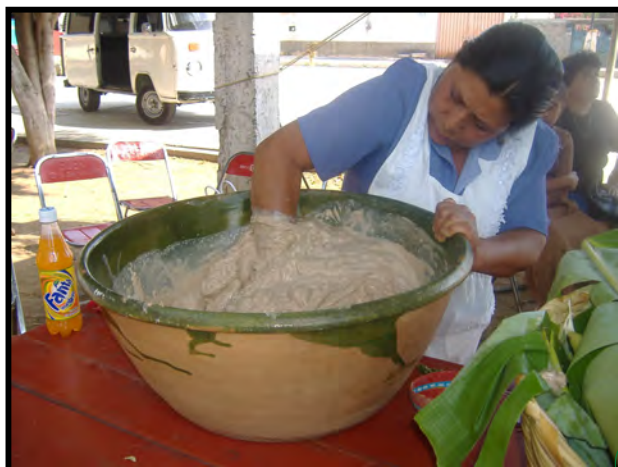
Elaboración del Tejate en Semana Santa