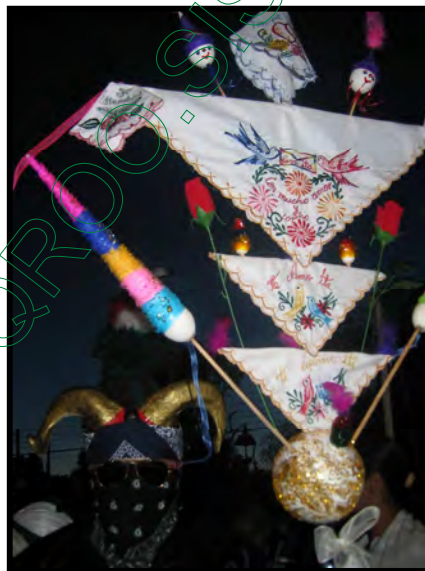
Una lira que fue regalada en la festividad de San José

Otros personajes que se presentaron en la festividad de San José fueron los diablos, cuya primera aparición fue el martes de carnaval que se realizó en la plaza y después en el miércoles de ceniza que al igual se efectuó en el plaza, continuando en la festividad del barrio de San Pablo la Raya; culminaron en la festividad de la capilla de San José Patriarca. Son personajes que se dedican a regalar cascarones, liras, plumeros y aventar harina o confeti a las mujeres solteras. Sí una persona recibe un regalo es símbolo de que le agrada, en el caso de la lira significa un compromiso de casamiento ya que al día siguiente se llevará el anillo de compromiso a la casa de la novia por parte del novio. Este hecho social se puede ligar con el ritual de pasaje o tránsito que consiste en incorporarse hacia otra etapa del ciclo de vida, en este caso es el matrimonio. (Barabas, 2004 70-72).