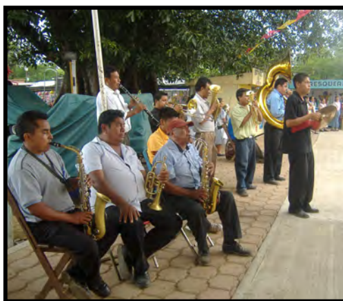
Banda de Música en la Festividad de San Pedro

En la Villa de Zaachila se encuentra la banda musical “Baalachi”, interpreta las piezas musicales de la danza, en ocasiones es contratado para participar en las festividades o para un evento civil. Otras bandas que interpretan las piezas de la danza son provenientes de las comunidades de Róalo, Jalpan y La Trinidad Zaachila.