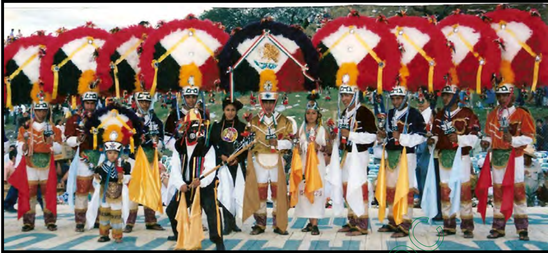
Grupo de danza "Teotzapotlan" en la Guelaguetza 2005 de la Villa de Zaachila