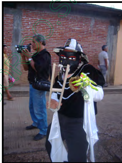
Negrito o Campo