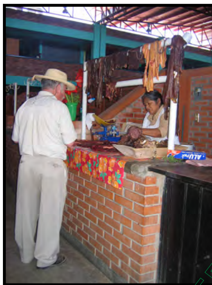
Venta de carne de res en el mercado Alarri

Detrás del mercado se encuentra la venta de frutas, verduras y mariscos. Sobre la calle Coyolicaltzin y parte de la calle Kosijoeza se da la venta de comida, entre ellas está la venta de tacos y consomé de barbacoa de chivo y de borrego, la venta de empanadas, memelas y tlayudas, la venta de tacos de carne de res y de puerco, al igual se da la venta de frutas, verduras y la venta de ropa. A un costado de los puestos de nieves sobre la calle Coyolicaltzin se pueden comprar dulces tradicionales, flores, guajolotes, gallinas, gallos y huevos de patio, frente a municipio al igual se da la venta ropa, zapatos y artículos para la mujer, sobre la calle pezelayo se da la venta de artículos para el hogar, ropa y discos compactos.