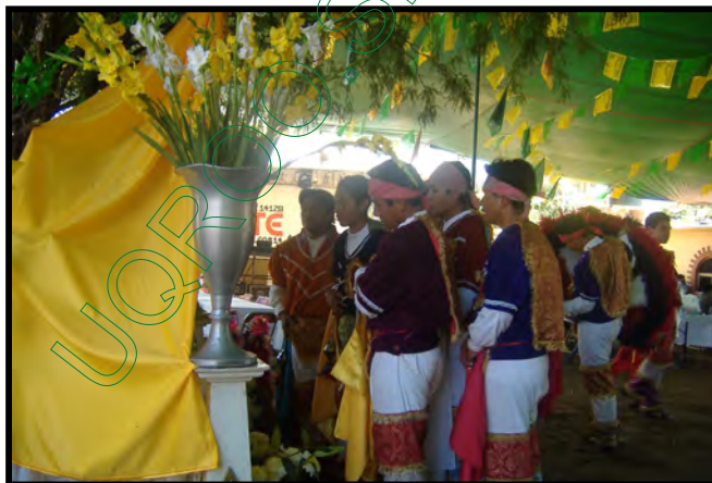
Jóvenes del grupo “Teotzapotlan” en la mayordomía de San José

En lo que respecta a la participación de la Danza de la Pluma, que el eje articulador de la tesis se describirá a continuación. Para esta ocasión fue invitado el grupo de la Danza de la Pluma “Teotzapotlan” a cargo del maestro José Guadalupe Villareal. El grupo inició sus actividades en la misa que se celebró en el templo principal de la Villa, haciendo su presentación en el altar antes del ofertorio y al concluir la misa. Al terminar la celebración eucarística. Los danzantes se encargaron de llevar la imagen a su respectiva capilla. Cuando llegaron a la capilla del barrio de San José dejaron la imagen en la puerta ya que se celebró una misa. Por su parte el grupo “Teotzapotlan” se dirigió a la casa de los mayordomos para ejecutar unas danzas.