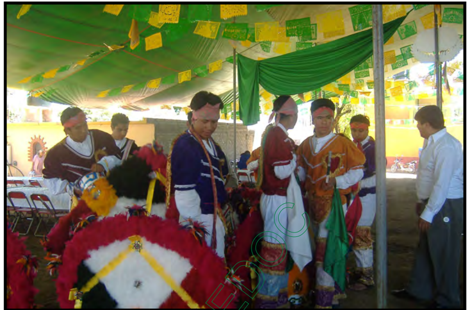
Mayordomos recibiendo a la imagen del Apóstol San Pedro