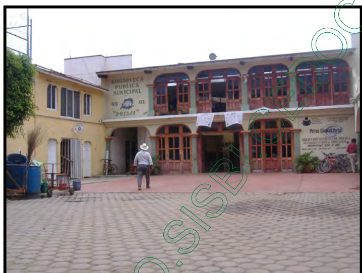
Palacio Municipal de la Villa Zaachila.