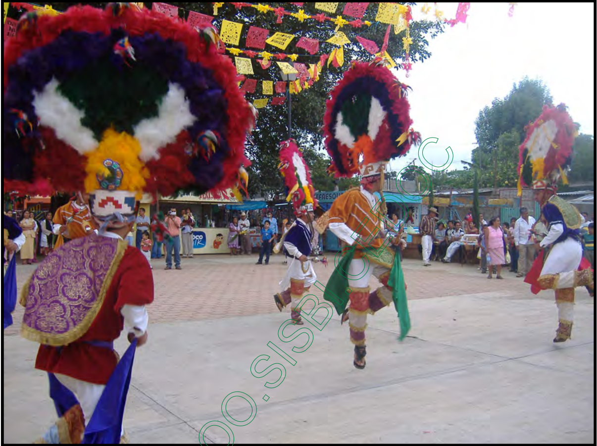
Grupo de la Danza de la Pluma "Teotzapotlan" en la Festividad de San Pedro.