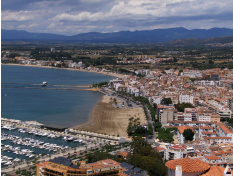
FIGURA 1. VISTA DE LA BAHÍA Y EL CASCO HISTÓRICO DE ROSES

Roses pasó de una población de 2 703 habitantes en 1950 a 12 991 en 2000, y para el año 2009 a 20 197 habitantes, con una densidad de 440 hab./km 2 . La tasa de crecimiento es de tan solo 1.4 %, pero más alta que el promedio de Cataluña (1.15 %) y España (1.08 %). Los pobladores de Roses son sobre todo inmigrantes: 32 % de ellos son de origen extranjero, tasa sensiblemente más alta que la de Cataluña (13.4 %). Los inmigrantes de origen europeo (Francia, Alemania e Inglaterra) y que corresponden a población de segunda residencia constituyen 47 %; y 34 % de la población extranjera es originaria del norte de África (en especial Marruecos y Argelia), en su mayoría trabajadores en el sector de servicios. Roses es un importante polo de atracción de inmigrantes en Cataluña, 57 % de sus habitantes no nacieron en la ciudad. La población flotante de Roses llega a ser de hasta 70 000 personas en la temporada alta del turismo –de junio a septiembre– (Barris, 2008).