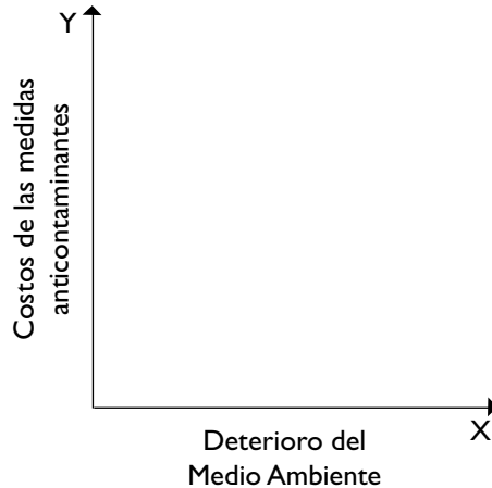
FIGURA 2. PROBLEMA BIDIMENSIONAL DE LA GESTIÓN MEDIOAMBIENTAL