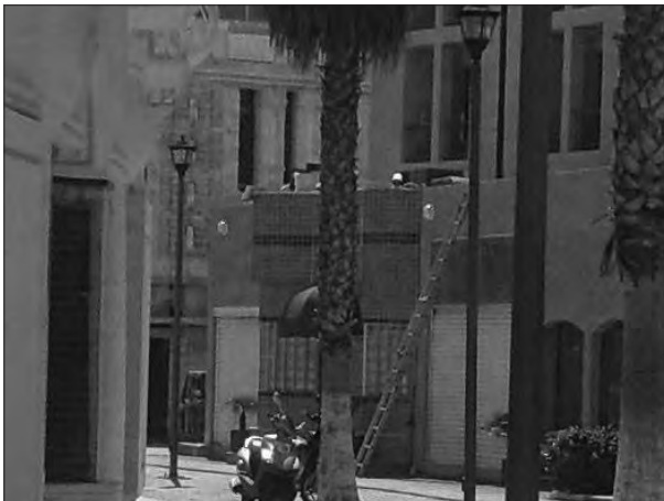
Figura 4. Casa de masajes spa .

Se observa la llegada en forma frecuente de turistas que son trasladados hasta ese lugar por los conductores de taxi: