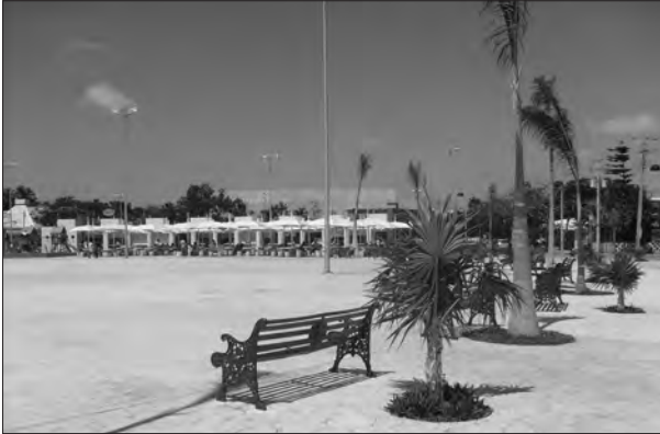
Figura 8. Parque Las Palmas.