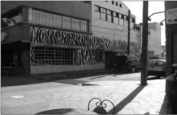
Figura 6. Disco Karamba.