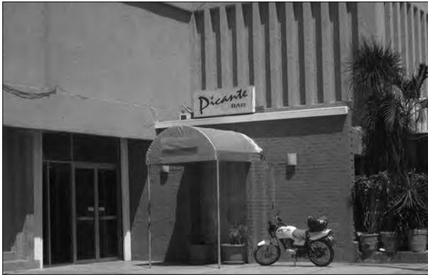
Figura 7. Disco Picante.