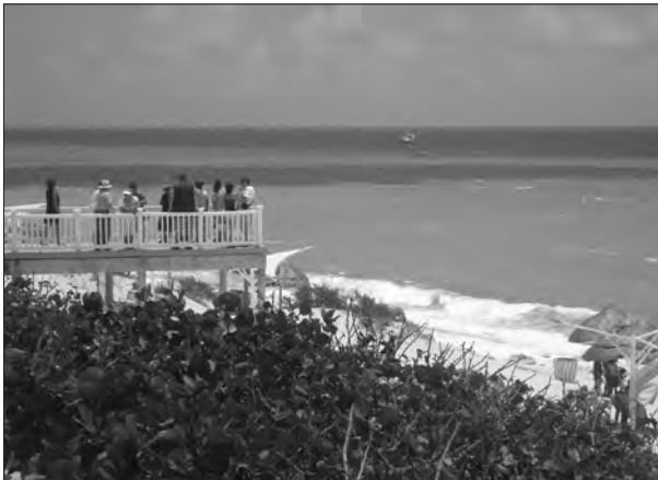
Figura 3. El mirador en Playa Delfines, Cancún.

Spa . En la zona hotelera, a espaldas de la Plaza Caracol, se encuentra la plaza comercial “María Fer”, cuyos locales quedaron afectados por el paso del huracán